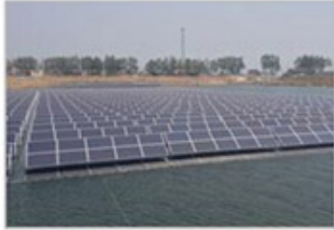
河北 亚洲最大水面光伏电站