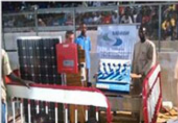
沙特阿拉伯 运动会光伏发电