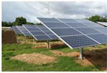
非洲马里 共和国光伏电站