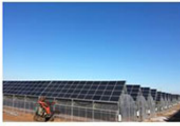
陕西 神木光伏农业大棚（牡丹种植）