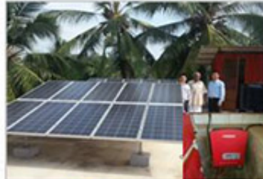
印度 高鸟发电站项目

易事特作为智慧城市和智慧能源系统解决方案供应商，长期专注于智慧城市&大数据、智慧能源、轨道交通等战略性新兴产业投资、建设与服务及核心产品的研发、生产、销售与服务。近年来，易事特在智慧能源领域取丰硕成果，先后建成了亚洲最大水面光伏发电站、临朐县光伏扶贫发电BOT项目等具有全国影响力的重大项目。今年9月，易事特自主研发的充电桩服务杭州G20峰会，备受全球瞩目。