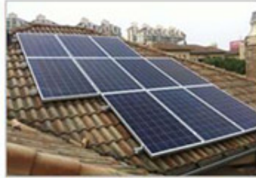
上海 别墅屋顶发电站