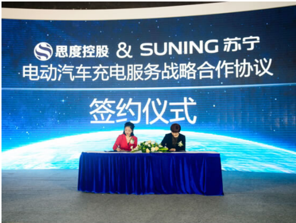
思度控股集团与苏宁就电动汽车充电服务战略合作协议签约

本次发布会上还举行了产业伙伴的战略合作签约。思度控股集团与苏宁、思度科技与中新房、云电科技与电动未来三家公司就充电基础设施建设等多个领域达成战略合作协议，将携手在新能源产业联合布局，实现资本、技术、服务等方向多赢格局。