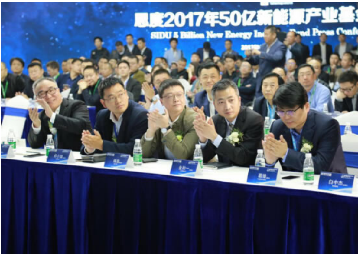
新能源行业精英与金融大咖共襄盛举

在现场全体参会嘉宾的瞩目下，本次50亿新能源产业基金的五个发起方领导共同触屏启动基金，标志着思度50亿新能源产业基金的正式发布。