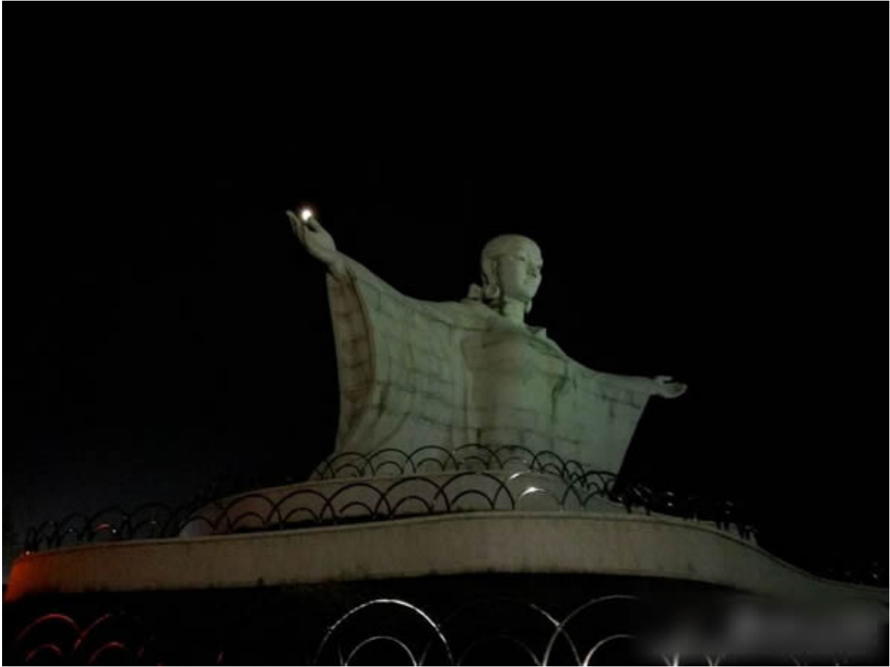
乳山的标志~一位伟大的母亲，是她哺育了这里勤劳善良的人民。