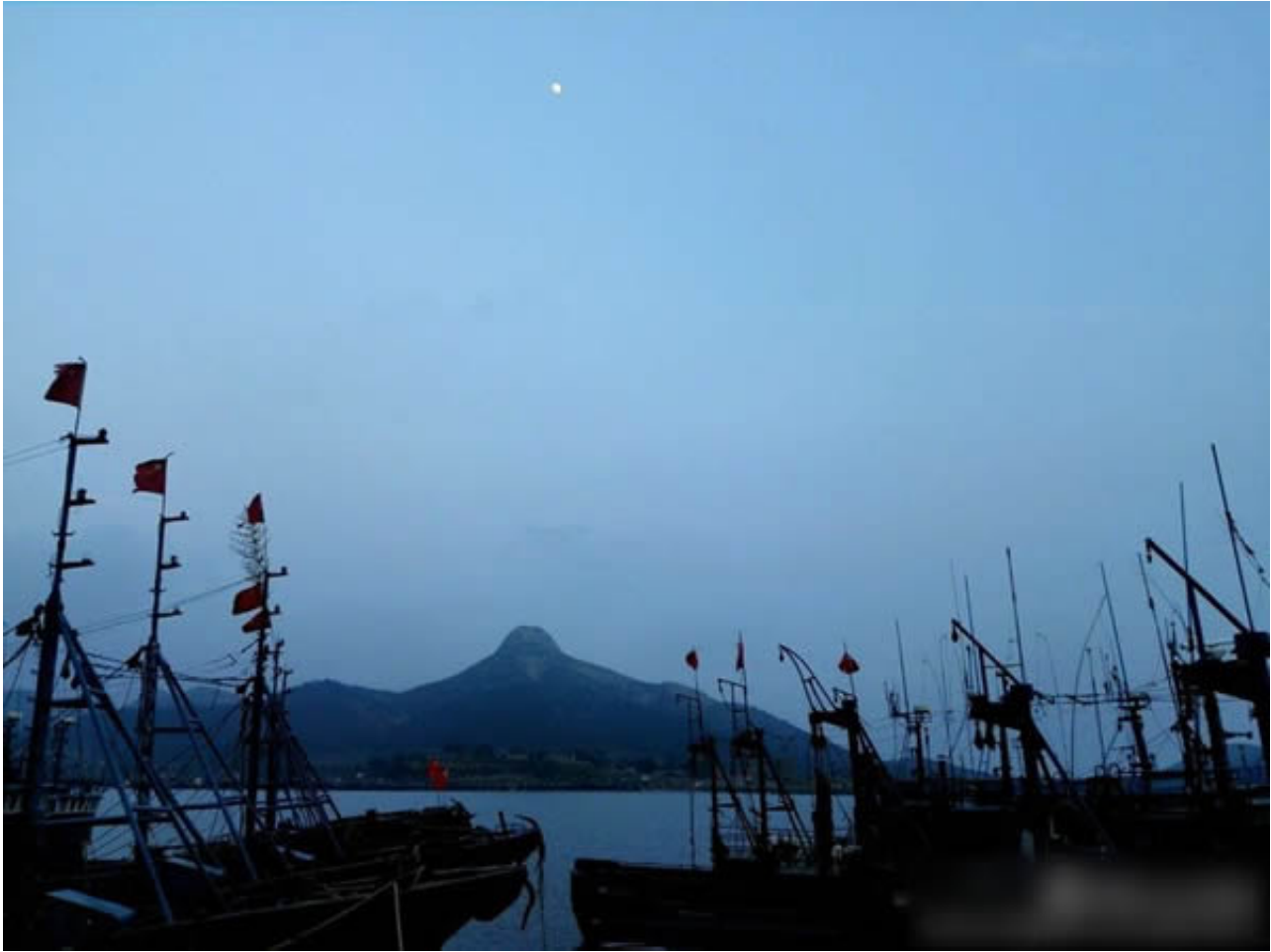
山东威海乳山，是个地杰人灵，风光秀丽，气候