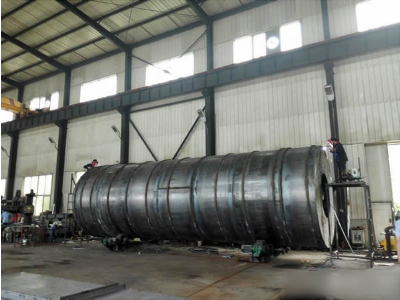
车间的半成品~滚筒