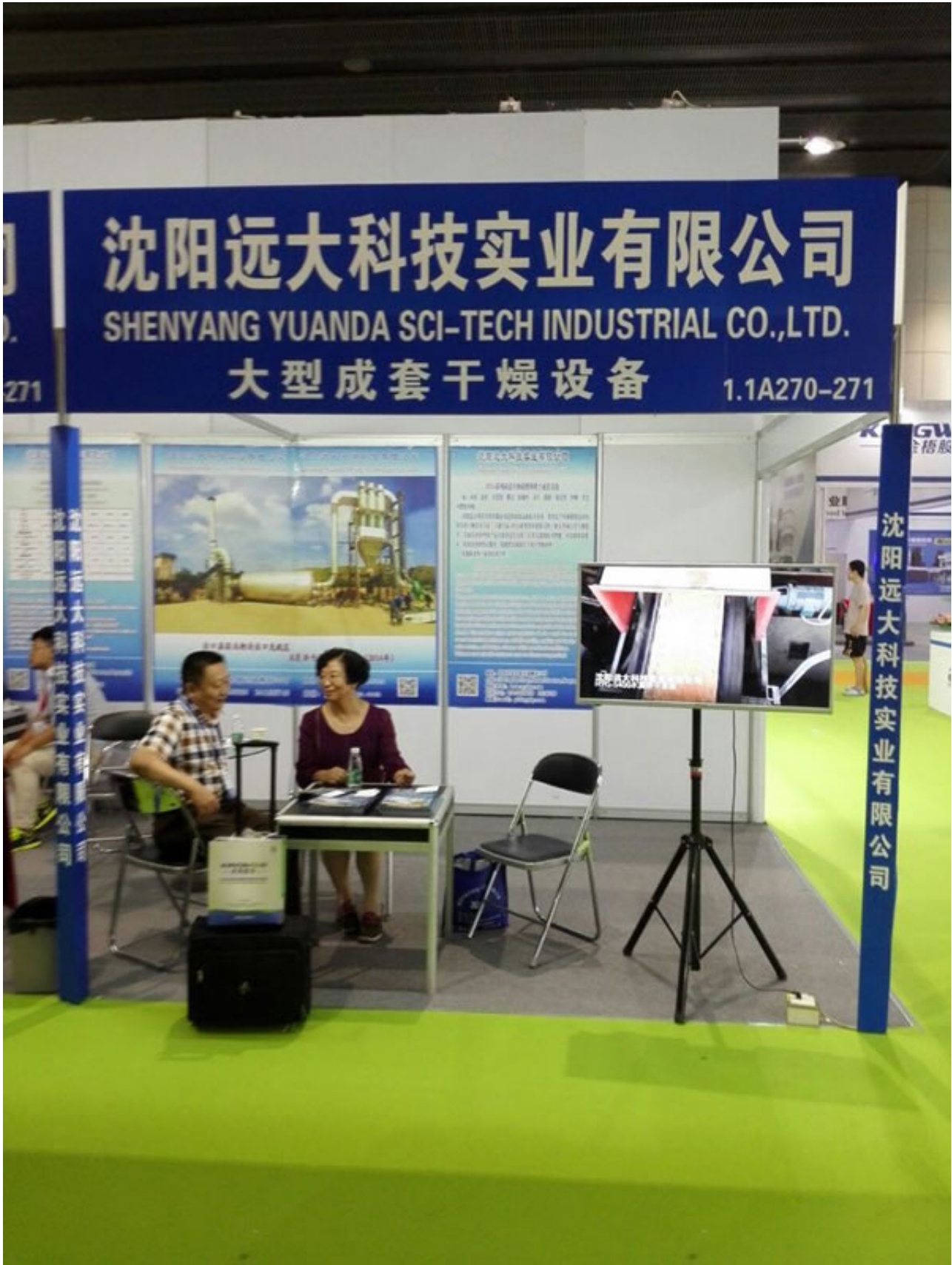
沈阳远大，在广州的展会上。