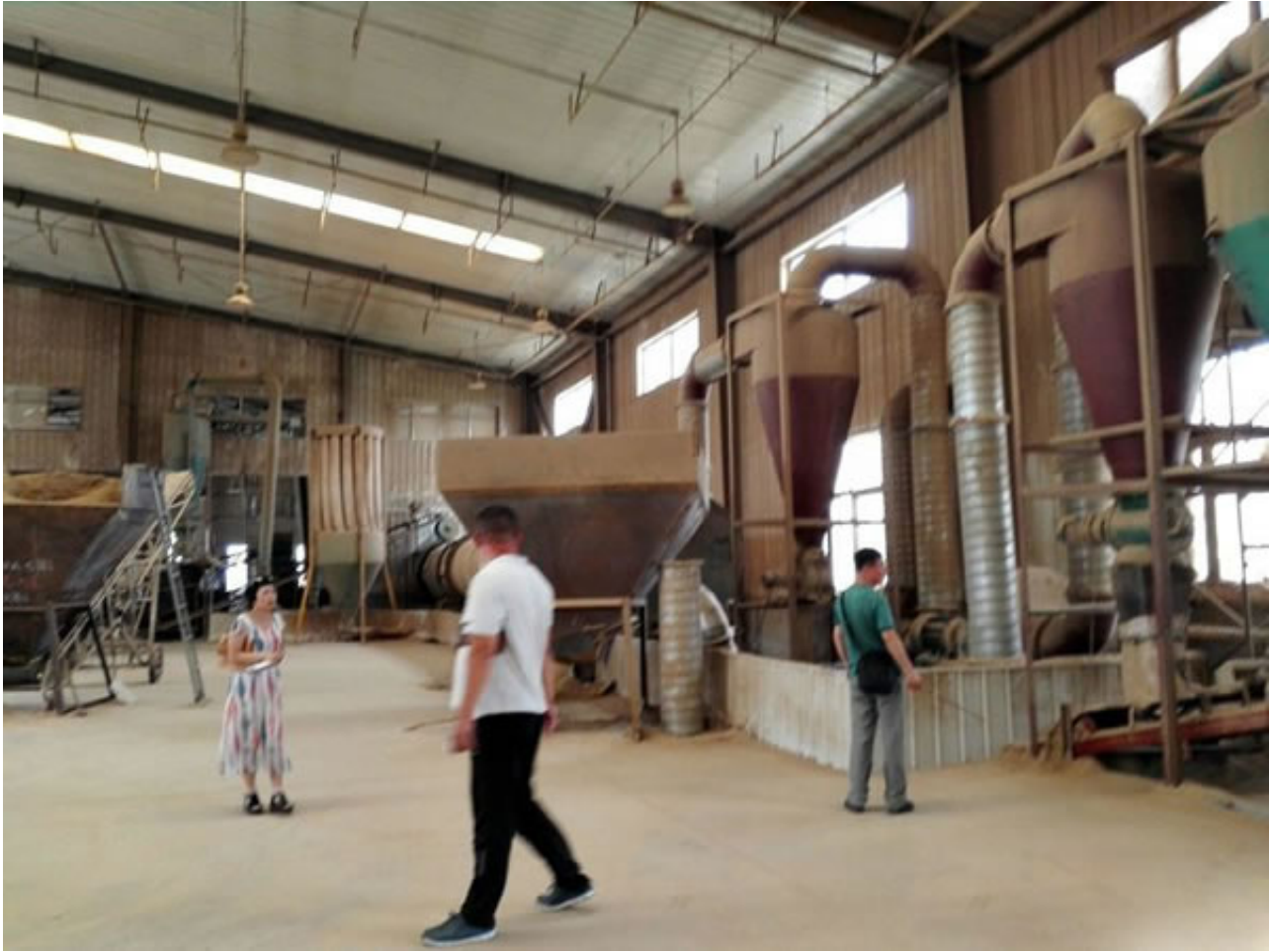
沈阳远大的工程师来到威海乳山的碧云天公司，现场考察场地情况。以便拿出最好的设计方案。