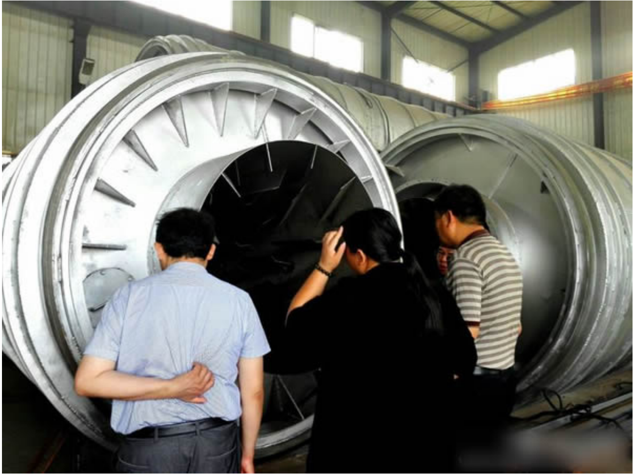
威海乳山碧云天公司的领导人，来公司的生产车间，考察设的加工质量，观看内部结构。