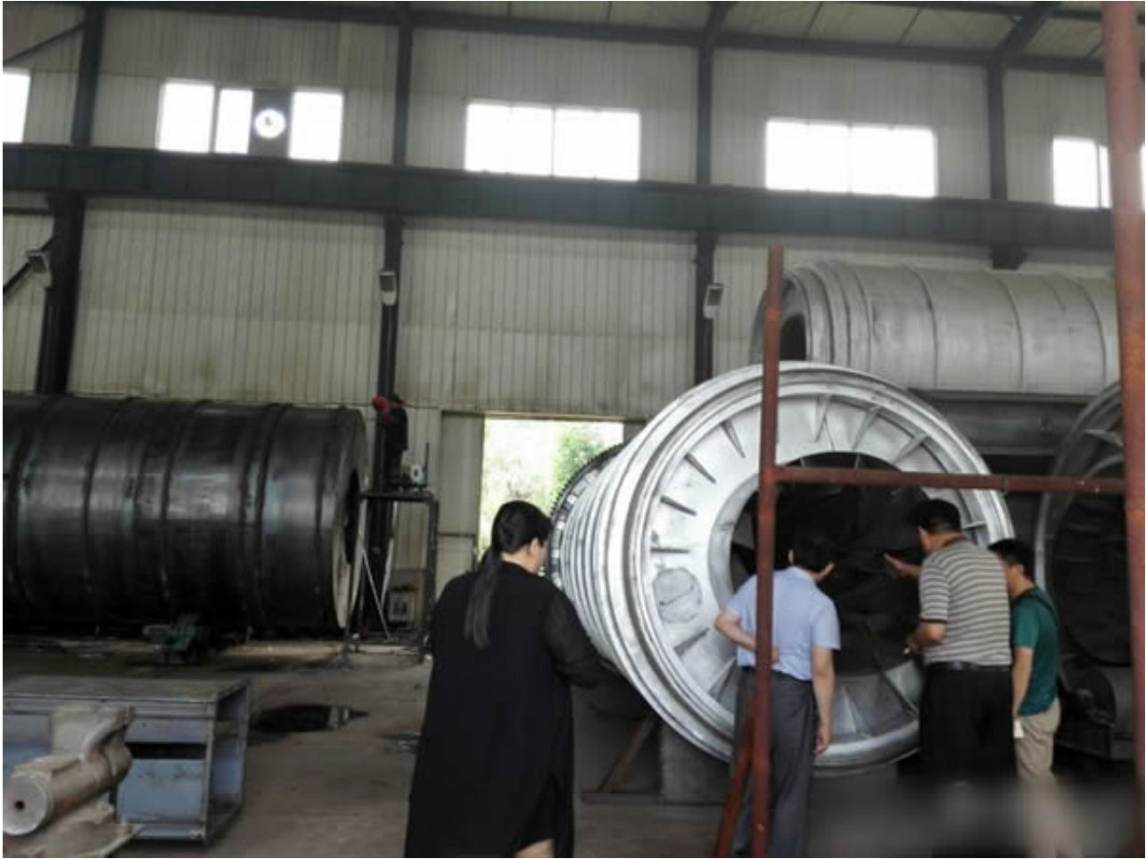
了解设备的内部结构和工作原理。