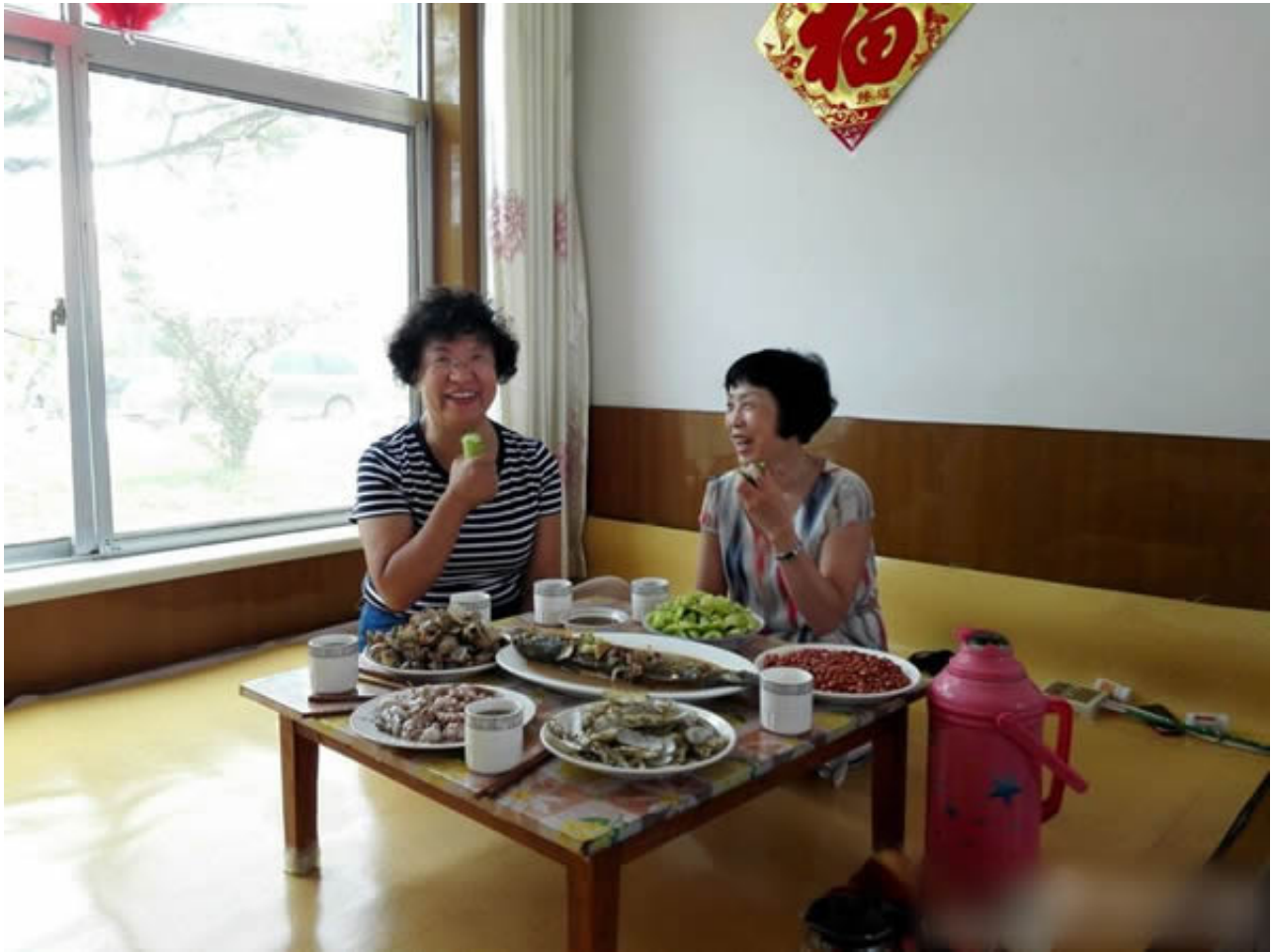
沈阳远大的申副总经理和刘工程师在威海乳山的董事长家里，好亲切啊！坐在炕上的感觉真好！