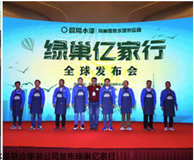
左图/水漆普及进千城 右图/晨阳水漆联合家装公司发布绿巢亿家行