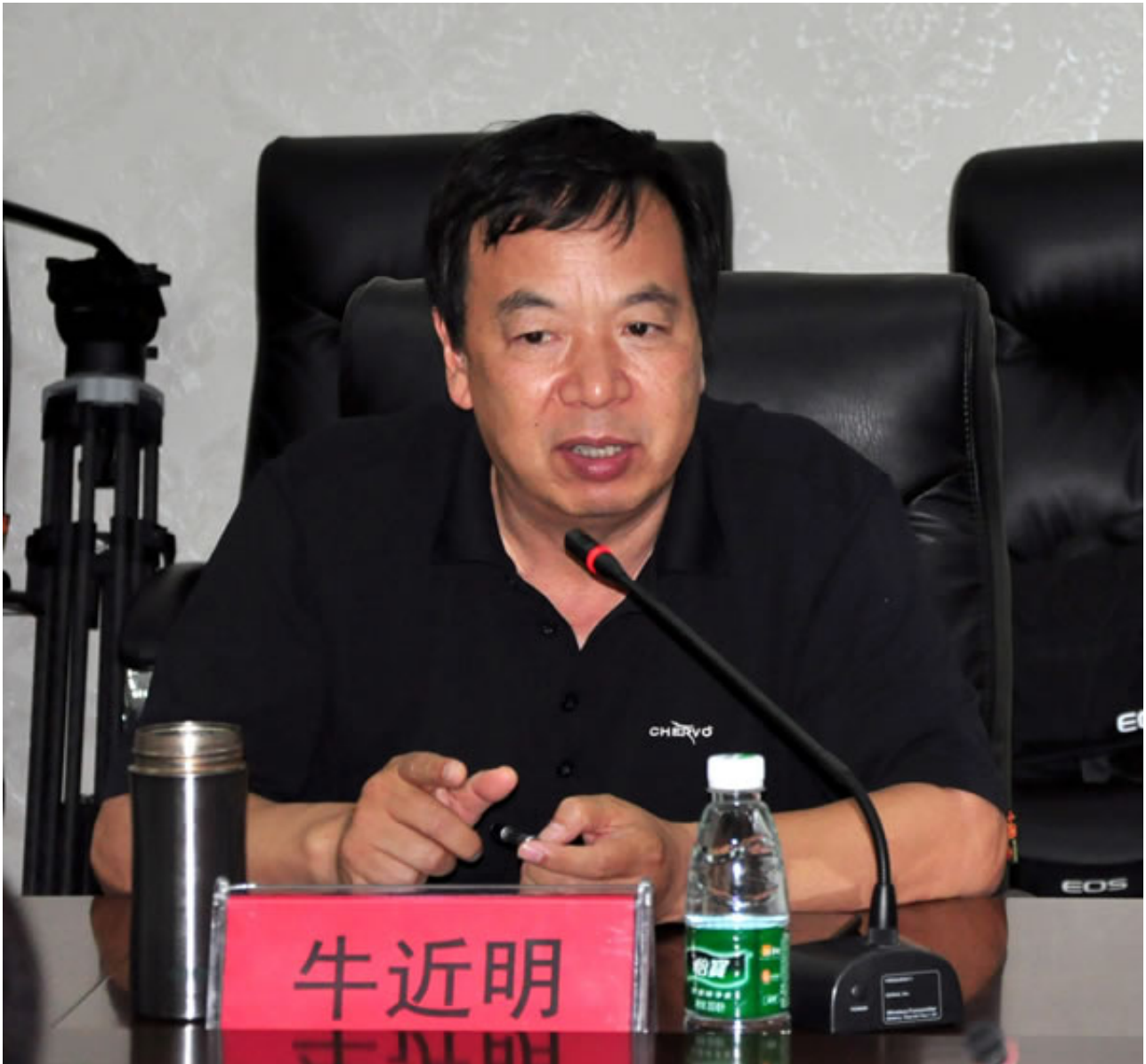
2017年10月19日中城新能源和城建重工（唐山曹妃甸）新能源汽车科技有限公司正式成为京津冀新能源汽车与智能网联汽车协同创新联盟发起单位，联盟首批成员单位已超过60家，业务范围涵盖新能源汽车行业组织、整车及关键零部件制造、充电桩建设及运营、分时租赁、金融投资等京津冀地区多个新能源汽车相关产业领域和细分专业领域。