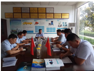
要有集体责任感，群策群力，为企业发展，同心同德，共同奋进。