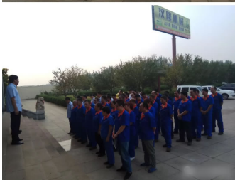
福总召开全体销售人员会议，就8月份的参加各重大展会提出一 参会人员需注意安全、服从安排、引起重视。