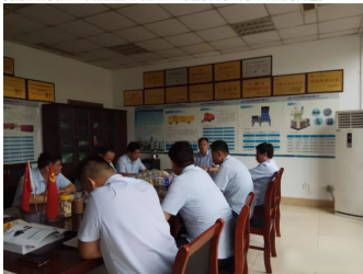
端正思想、统一认识，一切以公司发展利益为目标。