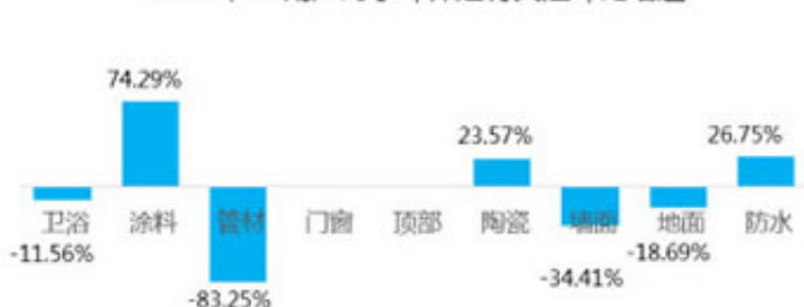
2018年H1用户对于环保建材关注环比增速