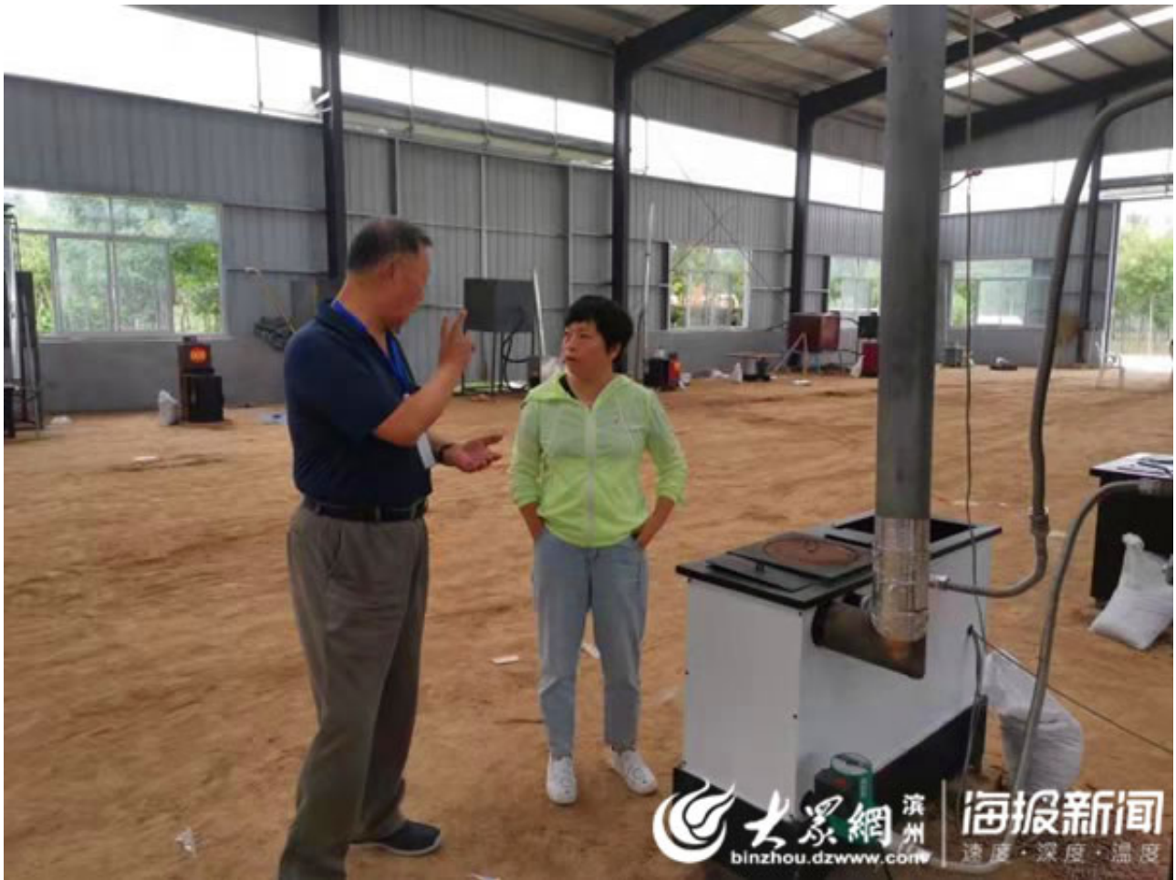
讲解基本注意事项