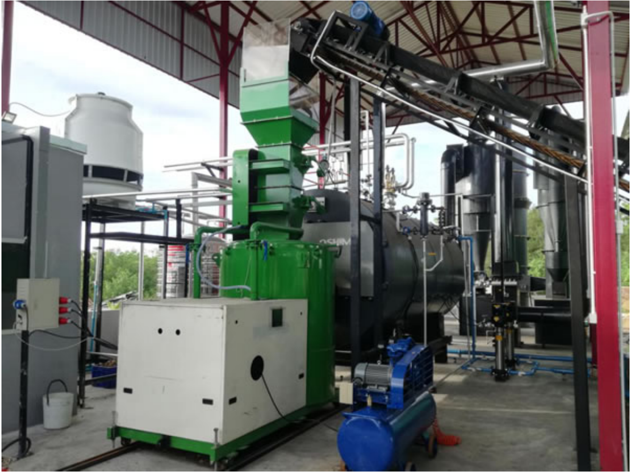
博恩360万大卡颗粒燃烧机配套滚筒烘干线在韩国