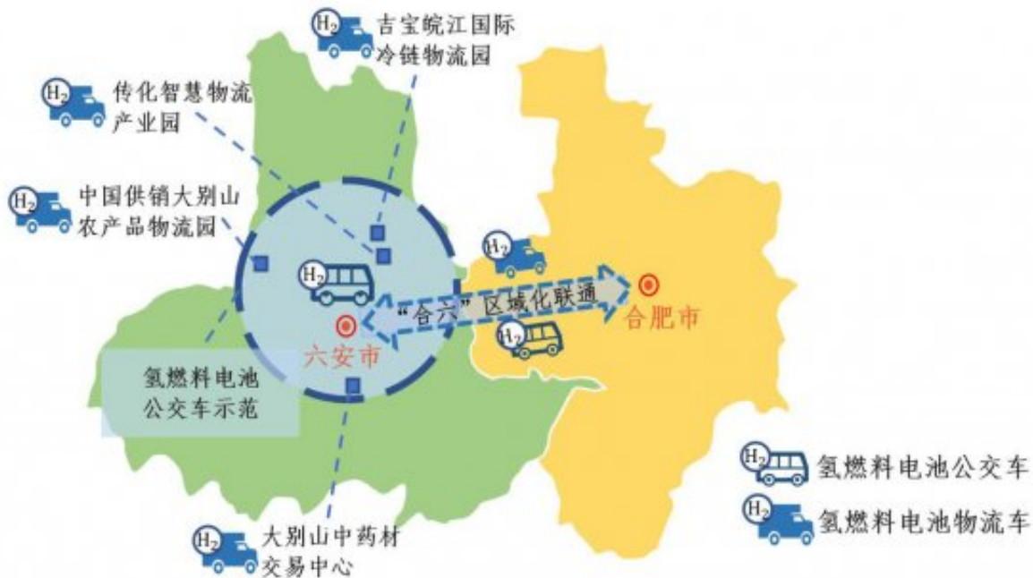
图 2 燃料电池汽车示范应用图