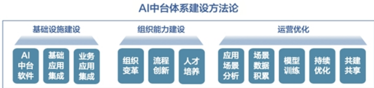
图:三大要素全面支撑企业智能化升级

面向企业智能化升级的不同阶段，AI中台建设有两类路径:一类是对于处于AI能力起步期的企业，会先从AI能力直接赋能，再逐步发展到自主建模和个性化创新，构建AI能力创新底座;另外是面向已具备专业AI建模专家及算法团队的企业，可以聚焦个性化AI研发能力的构建，进而大幅提升AI模型落地应用推广效率。