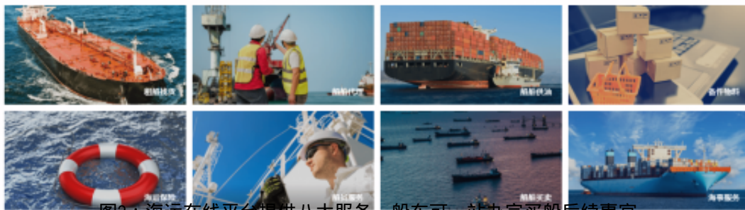
图2：海运在线平台提供八大服务，船东可一站办完买船后续事宜。

海运在线通过引入互联网平台和APP交易模式，为海运界提供了一个高效的船舶买卖解决方案。截至目前，海运在线平台已成交数十艘船舶，客户来自印尼、中国、新加坡、越南，以及其他多个国家与地区。