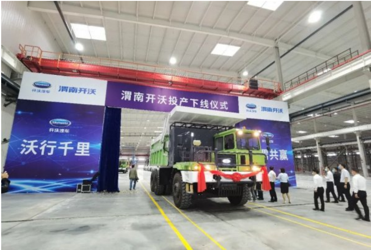
首台车辆下线 开启渭南新能源发展新局面

渭南，地处我国版图中心，“隶属”西安半小时经济圈，是亚欧大陆经济带的重要组成部分，更是开拓西北、西南、中原市场的战略要地。