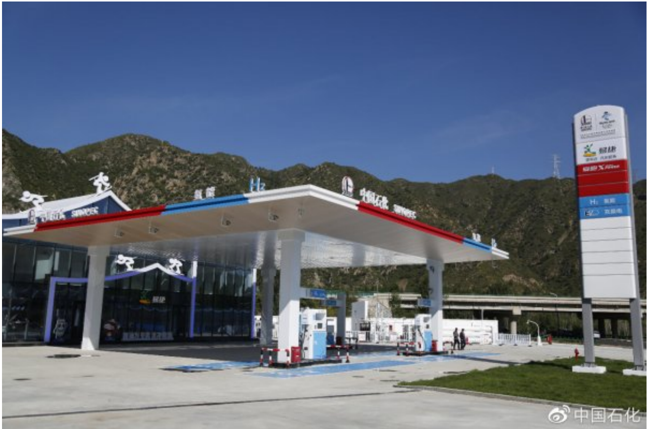
中国石化党组副书记赵东和北京市政府、北京冬奥组委相关领导共同出席启动仪式。

原文地址： http://www.china-nengyuan.com/news/173382.html