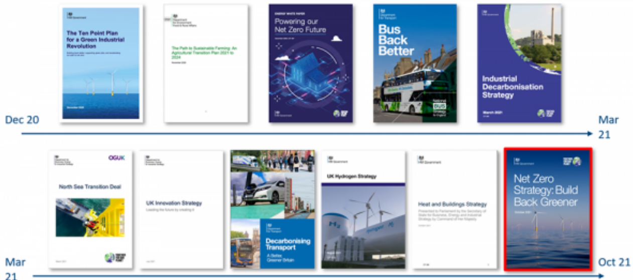
英国近年发布的能源转型相关政策

去年10月，英国发布了具有里程碑意义的《净零战略（Net Zero Strategy）》，全面阐述了英国如何在2050年实现气候变化“净零排放”承诺，以及如何在2030年提供44万个高薪岗位，并计划为此投资900亿英镑。该战略支持英国企业和消费者向清洁能源和绿色技术过渡，降低对化石燃料的依赖，鼓励投资可持续清洁能源，减少价格波动风险，增强能源安全；还计划支持英国在最新的低碳技术方面获得竞争优势，包括从热泵到电动汽车、从碳捕获到氢能等。主要投资计划包括：投资10亿英镑大力推动电动汽车发展，额外投资3.5亿英镑支持汽车及供应链电气化，6.2亿英镑支持特定电动汽车及基础设施建设（尤其是街道充电点）；额外投资5亿英镑支持未来绿色能源创新技术发展，使净零研究和创新总资金达到15亿英镑以上；投资39亿英镑支持供热和建筑脱碳等。