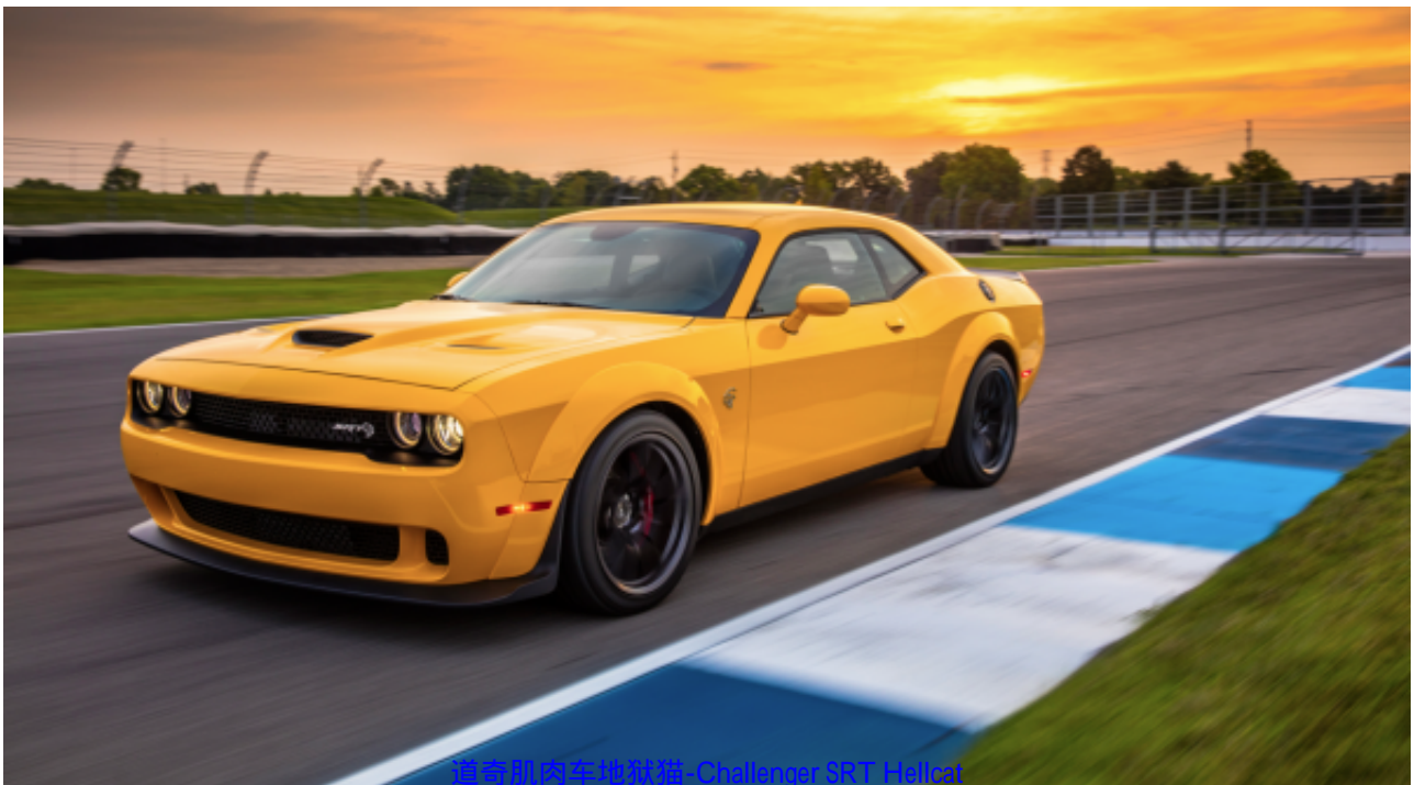
道奇肌肉车地狱猫-Challenger SRT Hellcat

正因如此，这家总部位于底特律的汽车制造商找到了一种方法来绕开即将出台的燃油汽车禁令。该公司宣布，计划推出一款800马力的氢燃料肌肉车，将取代其产品线中的“地狱猫”（Hellcat），命名为“SRT Hydra(九头蛇)”。