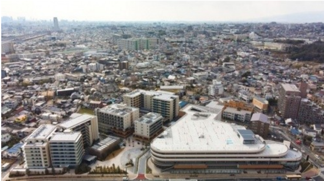
Suita可持续发展智慧城 全景图

近日松下集团宣布，在日本大阪府吹田市建设的Suita可持续发展智慧城(以下简称Suita SST)的家庭产权公寓、老年人产权公寓、单身者共同住宅、健康综合设施(附带服务的老年人住宅、阿兹海默症老人之家、居家护理设施、补习班、认可保育所)、交流公园竣工，伴随4月29日综合商业设施的开业，Suita SST正式对外开放。