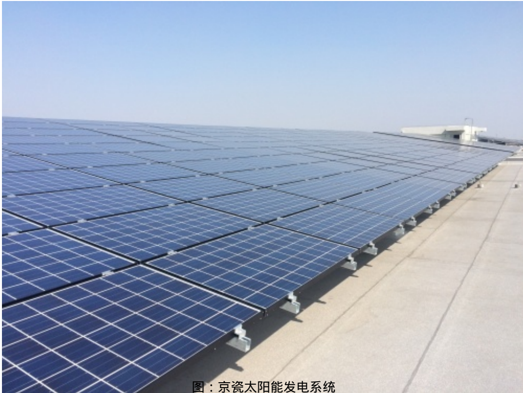
图：京瓷太阳能发电系统

京瓷智慧能源事业部秉持“敬天爱人”的理念，凭借在光伏发电领域数十年的丰富经验，通过电站系统设计优化、工程管理、智能运维等数字化技术，为工业客户提供从现场评估、电站设计、工程建设到电站运营的项目全生命周期解决方案，降低企业用能成本，助力企业实现绿色发电、有效减少碳排放的目标，实现清洁能源代替传统能源，以构建清洁低碳、安全高效的现代能源体系和以新能源为主体的新型电力系统，开启真正的零碳新时代。