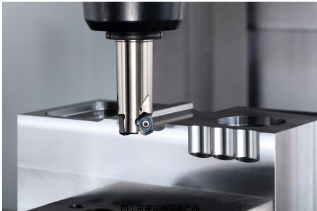
图：京瓷切削工具产品

在日常工作中，京瓷机械工具事业部专注于可研磨、可换式循环再生刀具和效率高多功能的复合刀具的设计开发，降低资源能源的消耗；并积极向客户提供改善方案，通过工艺流程的优化提高生产效率，提高良品率，减少浪费和降低废弃物排放等，以实际行动贯彻京瓷集团的经营思想。