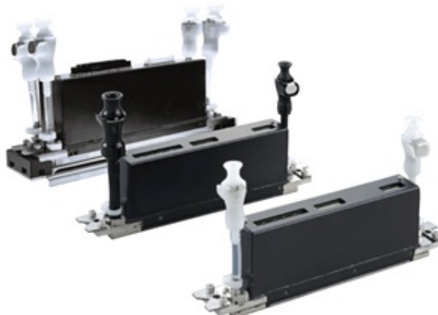
图：京瓷喷墨打印头