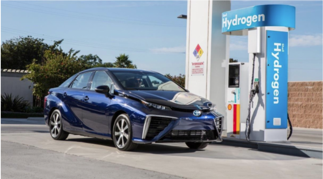
消费者和商用氢燃料汽车

研究预测，到2027年，全球氢燃料汽车中消费汽车的比重将超过60%，消费汽车将引领氢燃料汽车领域。