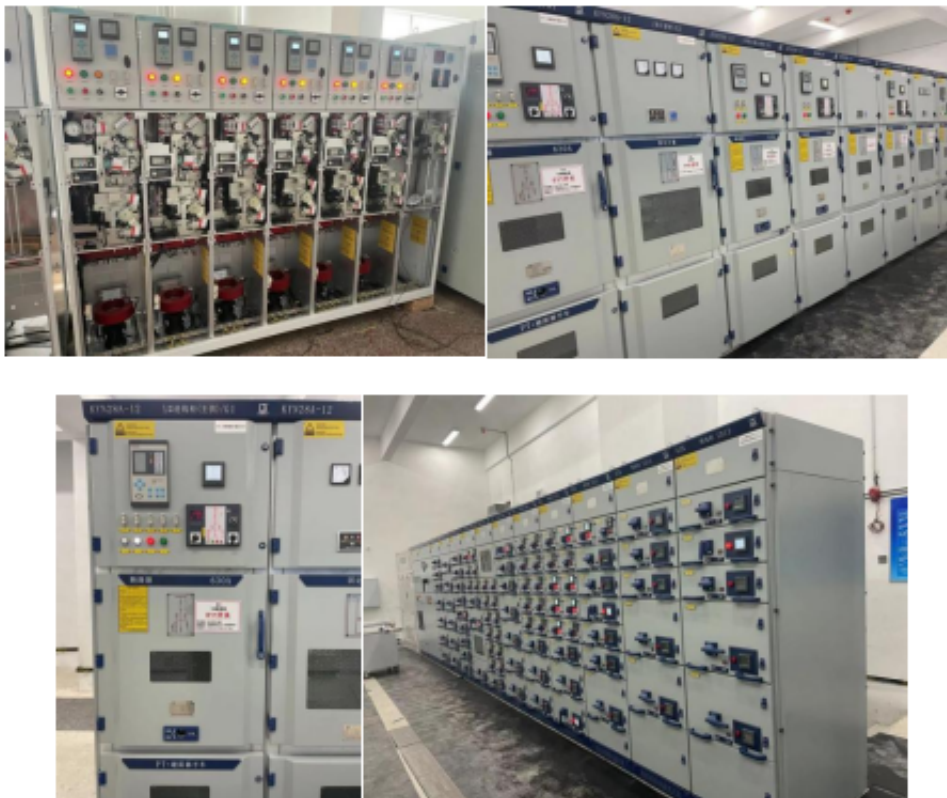
图3 微机保护装置以及电能表在贵阳万科翡翠滨江A1#楼配电项目现场安装图片

本项目微机保护就地分散安装在各个高压开关柜上，保护装置以及电能表现场安装如下图所示。