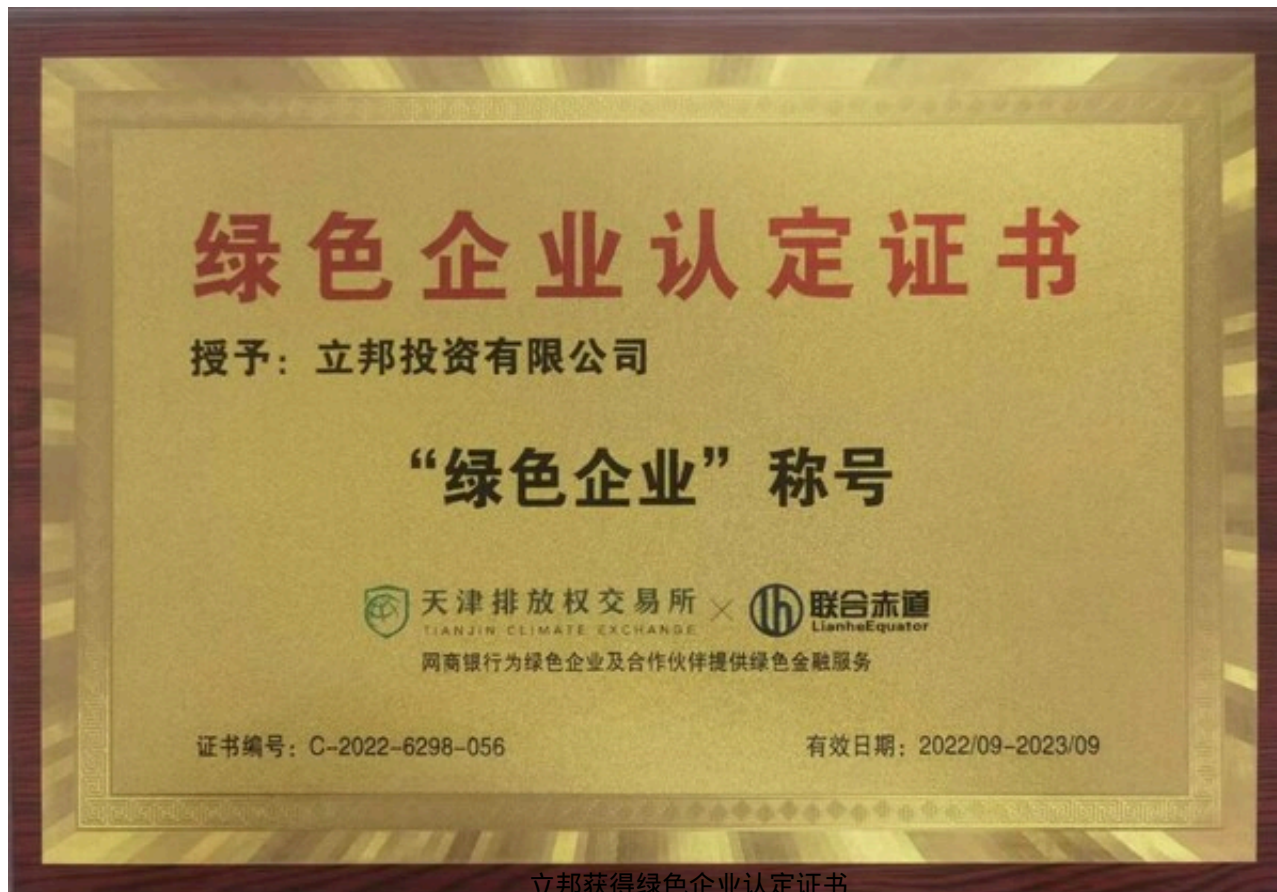
立邦获得绿色企业认证证书

绿色企业认证由网商银行与作为第三方独立权威机构的天津排放权交易所开展合作，制定供应链金融绿色企业认证评价标准和办法，并依据科学方法对网商银行的核心客户企业进行综合评估。[1]企业被认定为绿色企业之后，将在融资、科技创新等方面得到政府的政策补助，也可获得金融机构提供的差异化金融服务，其重要性得到了国内外微小企业的广泛关注。立邦多年来持续践行绿色行动，注重产品研发、生产、应用、运输等全产业链的每一步碳足迹，凭借优异的可持续建设成果获得了此次绿色企业认证，得以为上下游合作伙伴提供更有利的供应链金融资源，共同构建绿色生态圈。