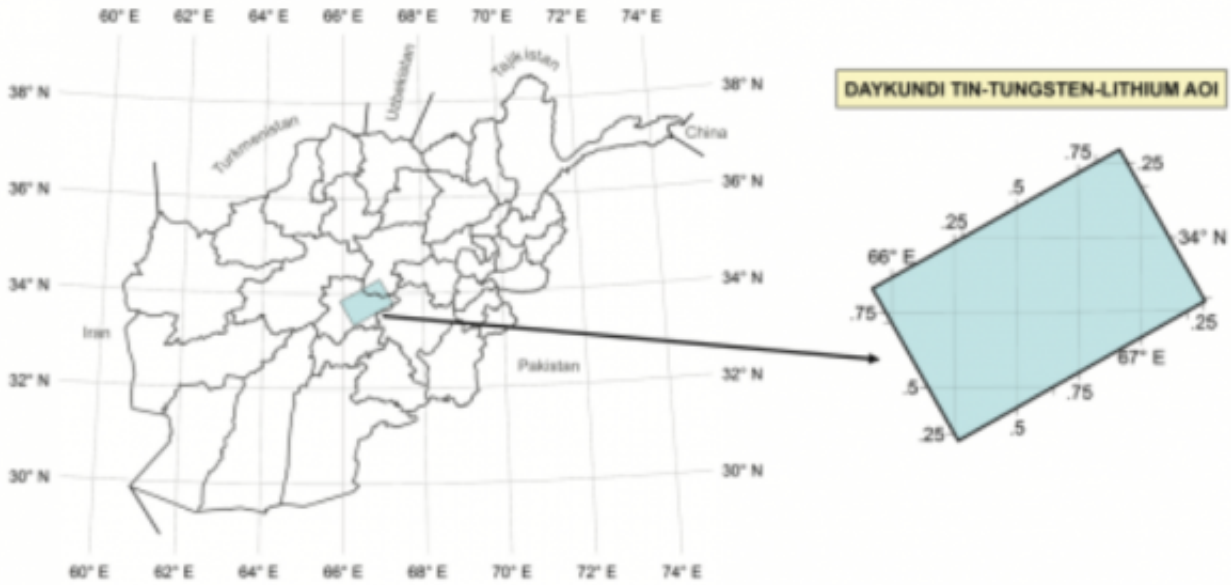
以阿富汗中部的Daykundi锡、钨和锂矿区为例。

2011年9月，美国地质勘探局在名为《阿富汗矿产投资和非燃料矿产生产机会的重要领域摘要》的报告中公布了调查结果。该报告的亮点包括在赫尔曼德省的Khanneshin碳酸盐岩地区估计发现了100万吨稀土元素。报告中描述的其他地区包括：喀布尔附近的大量铜和钴矿床，阿富汗中部富铁地区，东南部的铜和金矿，阿富汗中部的锡、钨和锂矿床。