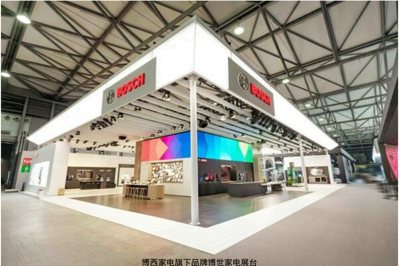
博西家电旗下品牌博世家电展台

除了创新科技产品带来的惊喜，博西家电还将可持续发展理念融入展台设计，旗下两大品牌的全品类产品与展台营造的场景化体验相融合，将博西家电所倡导的绿色高品质生活方式具象化呈现在广大消费者面前。其中，博世家电展台按照产品品类划分了不同区域，围绕“创新科技”和“嵌入式专家”呈现产品的出色性能及设计；此外，为更直观呈现产品的“可持续消费”优势，对应品类区域前方还设置了错落有致的显示屏组，直观展现产品的节水节能、减少食物浪费等可持续优势，为与会来宾全方位展示“科技成就生活之美”，也为广大消费者焕新更触手可及的可持续生活方式。