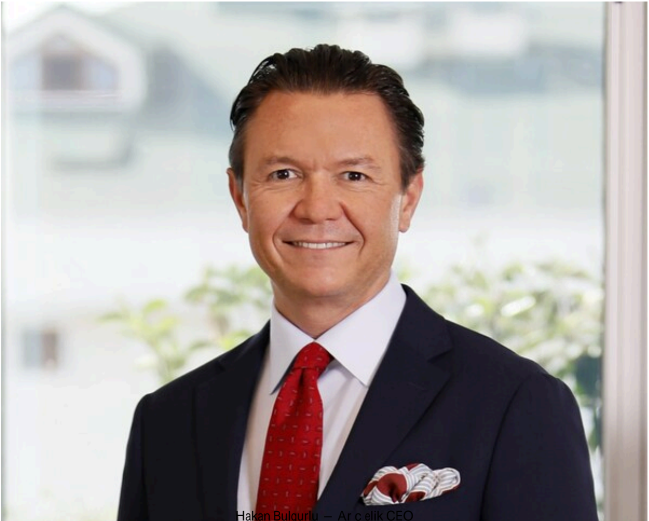
Hakan Bulgurlu – Arçelik CEO

2022年，在标普全球企业可持续发展评估的道琼斯可持续发展指数中，Arçelik连续第六年获得DHP家庭耐用品(DHP Household Durables)类别的最高分（基于2022年12月的结果）。凭借其在可持续发展方面的领导地位和实现净零排放的可靠脱碳路线图，Arçelik成为业内第一家也是唯一一家获得查理三世国王陛下颁发的地球宪章徽章(Terra Carta Seal)的公司。Arçelik的愿景是“尊重地球，方能受世人尊敬”。