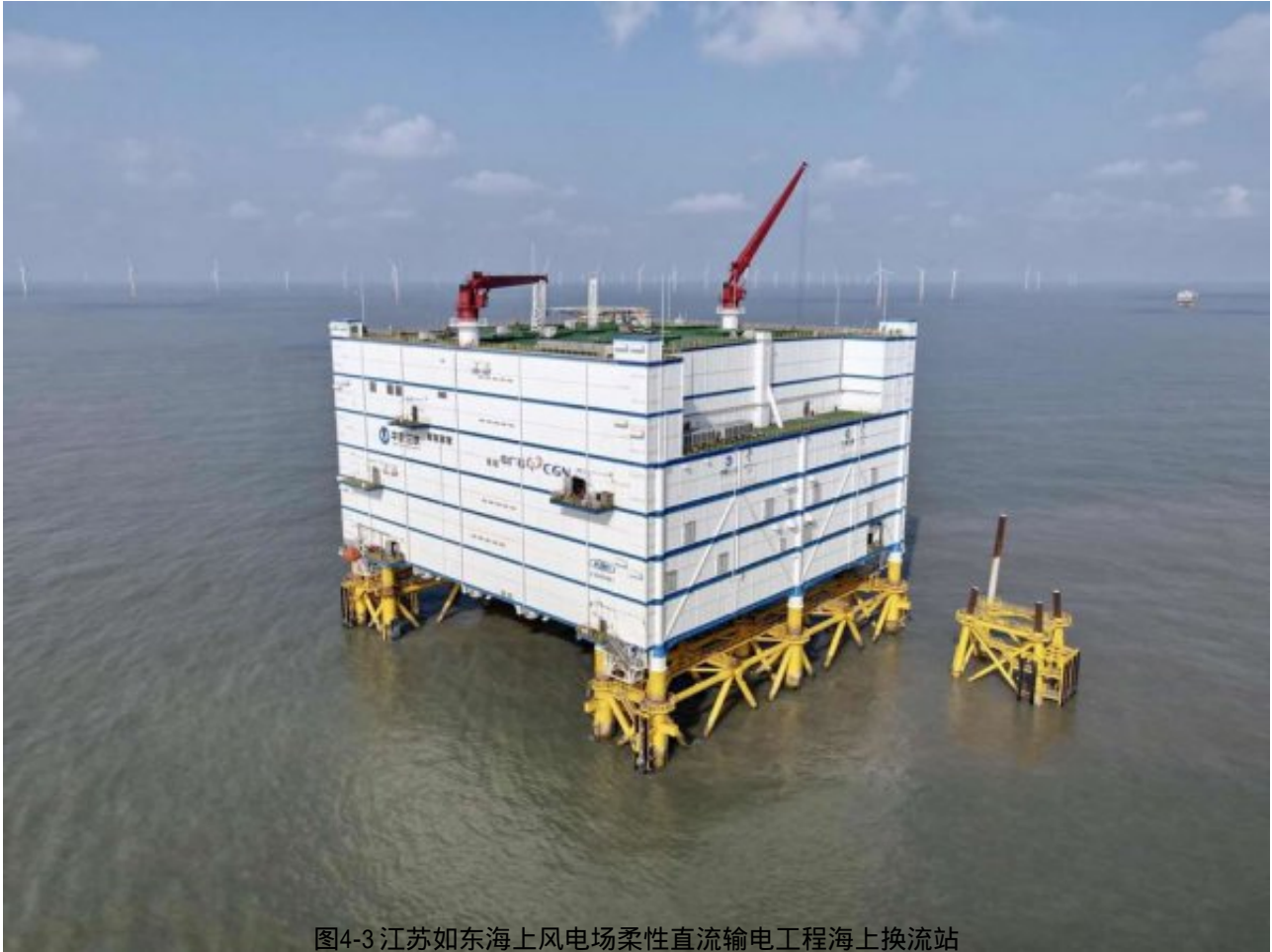
图4-3 江苏如东海上风电场柔性直流输电工程海上换流站

该项目年上网电量约33亿千瓦时，可满足约137万户家庭年用电，与同等规模的燃煤电厂相比，每年可节约标准煤约100万吨、减排二氧化碳约252万吨，节约淡水约979万立方米，具有重要经济、社会和生态效益。