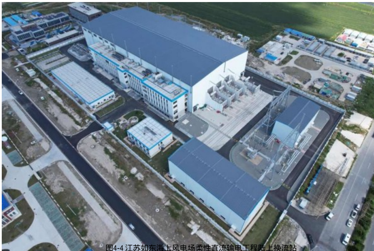
图4-4 江苏如东海上风电场柔性直流输电工程陆上换流站

主要政策点4：推动退役风电机组、光伏组件回收处理技术和相关新产业链发展，实现全生命周期闭环式绿色发展。