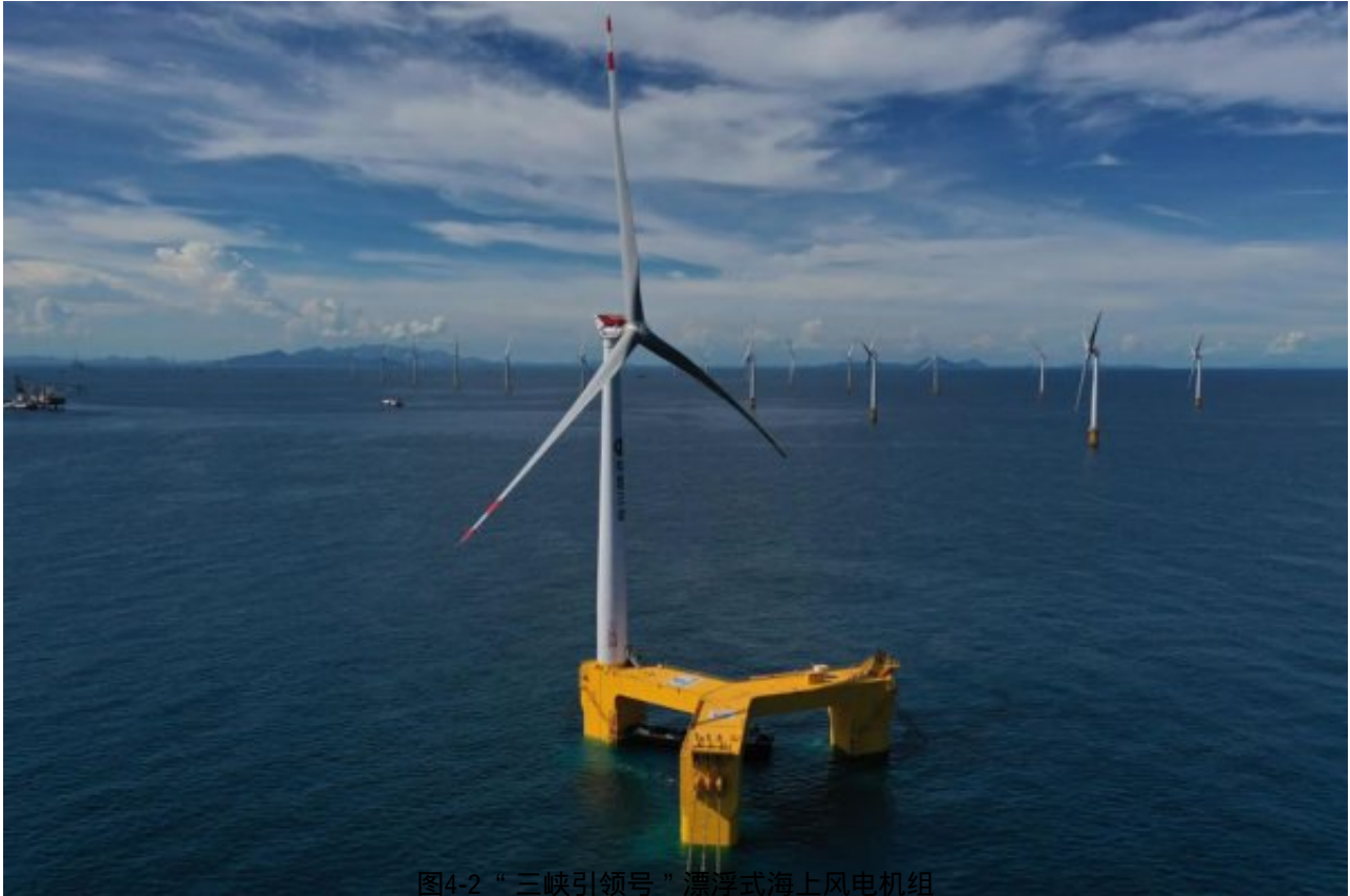
图4-2 “三峡引领号”漂浮式海上风电机组

本项目由上海勘测设计院、三峡能源联合明阳智能、华南理工大学共同研发，填补了国内漂浮式海上风电多项技术空白。项目依托的三峡新能源阳江百万千瓦海上风电场，于2018年初正式立项，2020年5月启动试验样机工程建设，2021年12月实现商业化并网发电，年平均上网电量1518万千瓦时，每年可节约标准煤约4600吨。