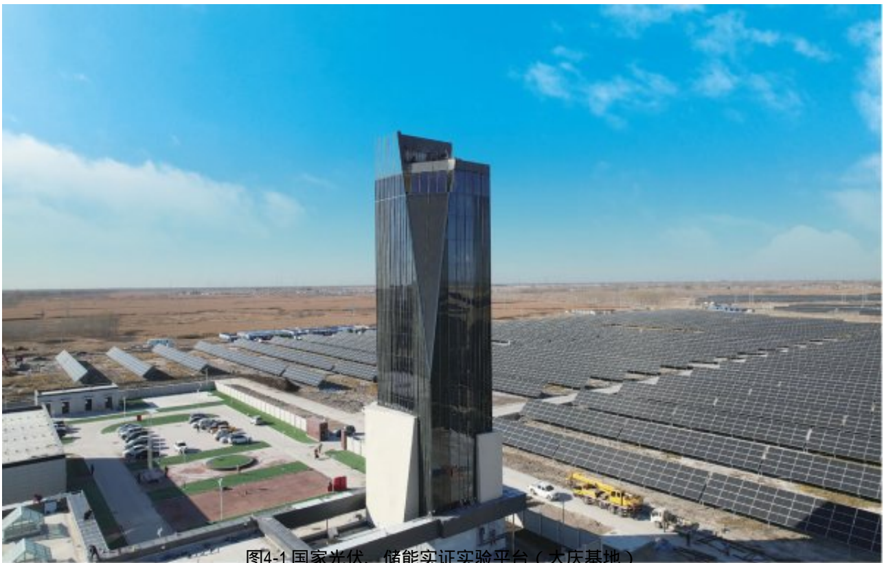
图4-1 国家光伏、储能实证实验平台（大庆基地）

国家光伏、储能实证实验平台（大庆基地）位于黑龙江省大庆市，是国家能源局批准的首个国家级光伏、储能户外实证实验平台，由国家电投黄河公司建设运维。平台可开展光伏和储能关键设备、产品、系统的户外实证实验检测工作，为新技术、新产品、新方案实际应用效果提供科学的检验对照数据支撑，为国家制定产业政策和技术标准提供科学依据，对推动行业技术进步、成果转化、产业发展具有重要意义。“十四五”期间，国家光伏、储能实证实验平台规划布置实证实验方案约640种，折算规模105万千瓦，逐年分期实施，2021年折算规模20万千瓦，2022-2025每年折算规模分别约15万千瓦、15万千瓦、30万千瓦、25万千瓦，总投资约60亿元。完全建成后，每年折算减少碳排放140万吨。目前，一期工程于2021年11月启动运行，布置了6个实验区、161种实证实验方案，二期工程于2022年5月开工建设，布置了4个实验区、111种实证实验方案。