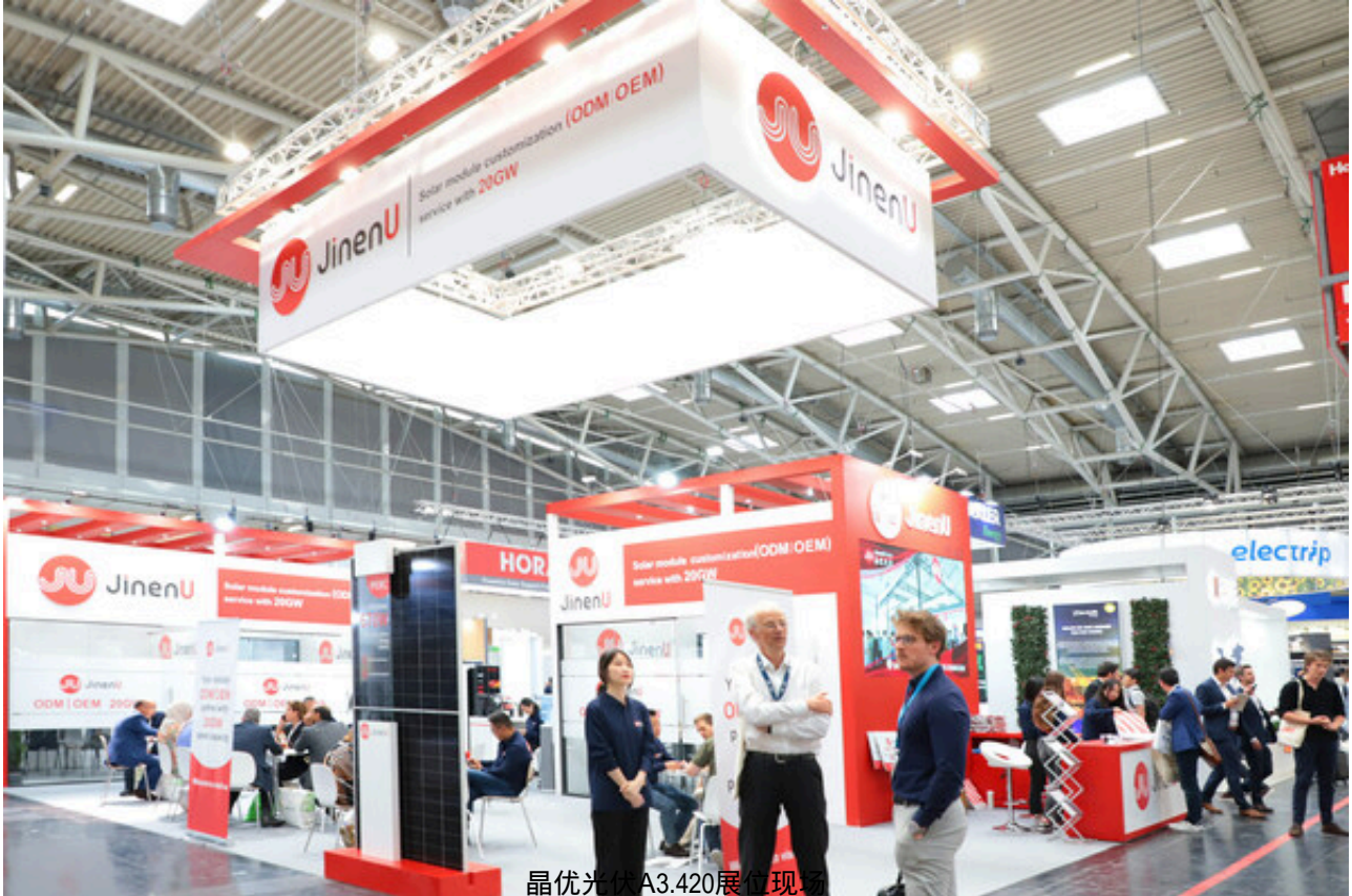
晶优光伏A3.420展位现场

慕尼黑2023年6月15日 /美通社/ -- 6月14日，Intersolar Europe 2023在德国慕尼黑展览中心拉开帷幕，晶优光伏首次亮相，惊艳全场，向全球光伏企业展示晶优光伏 OEM | ODM 的魅力。