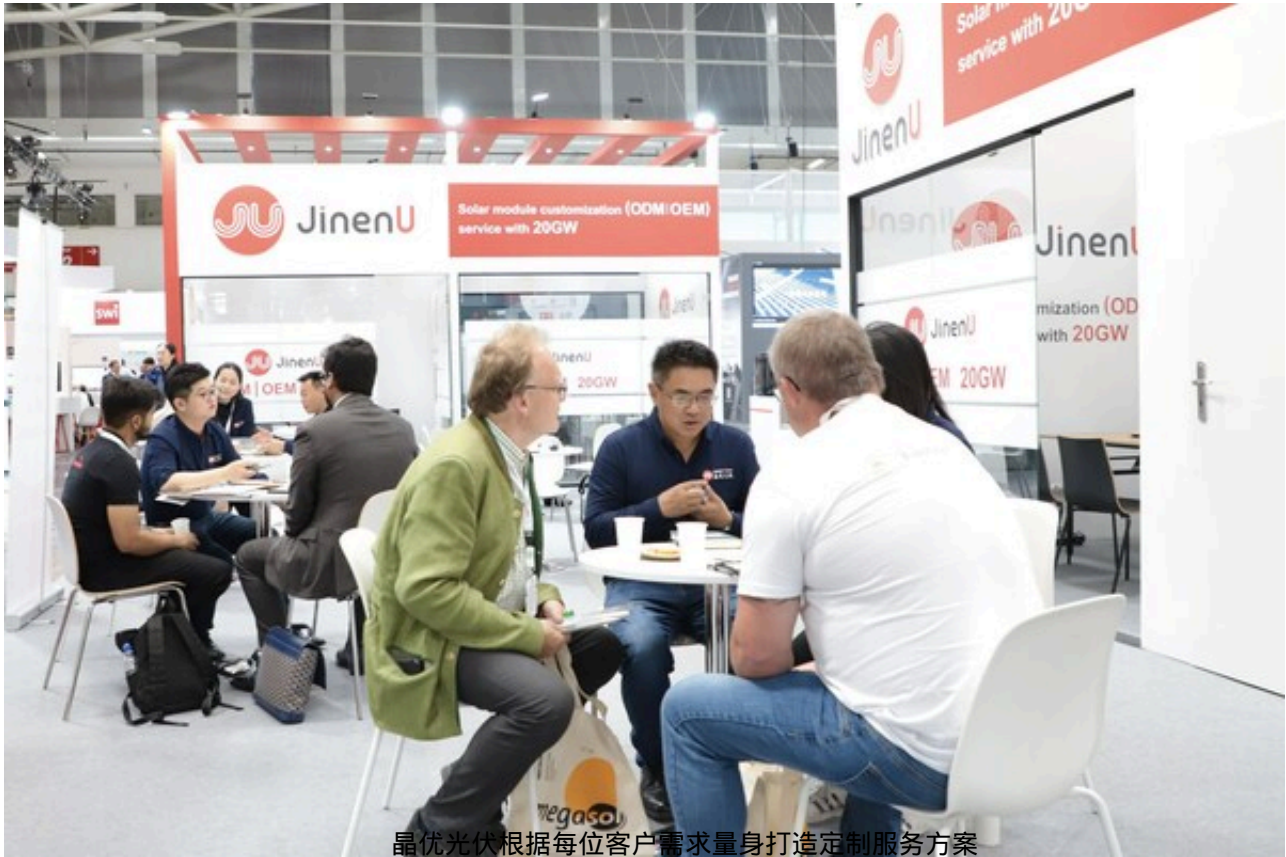
晶优光伏根据每位客户需求量身打造定制服务方案

一直以来，欧洲市场依赖于从中国进口光伏产品，2023年1月至2月，中国的组件出口额为478亿元，欧洲仍是中国光伏产品出口的第一大市场，超过一半的光伏组件被运往欧洲。