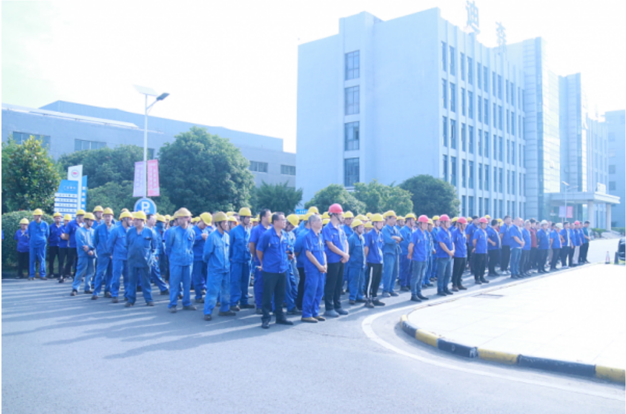
“质量月”活动启动仪式顺利举行

此次迪森“质量月”活动主题“增强质量意识，推进高质量发展”，围绕开展质量意识培训与宣贯、质量知识有奖问答、车间QC小组质量改善等活动，夯实质量管理基础，进一步提高全体员工质量意识，提升产品质量和服务质量。