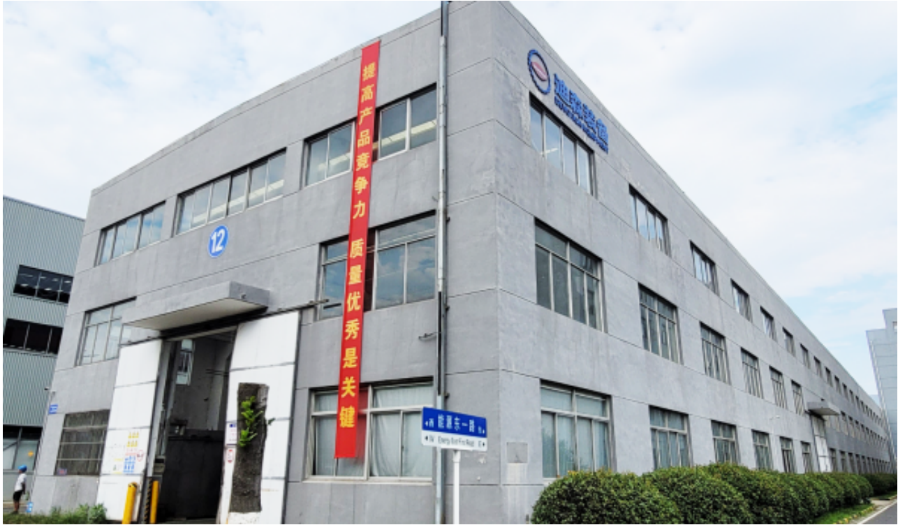
各车间已悬挂“质量月”横幅，全面营造活动氛围

质量是迪森人的自尊心！通过开展“质量月”活动，完整、准确、全面地贯彻质量理念，以高质量为追求，树立质量第一、质量创造效益的强烈意识，大力提升各部门质量管理水平，增强企业质量和品牌影响力，促进质量强企建设，以实际行动响应国家质量强国战略实施。