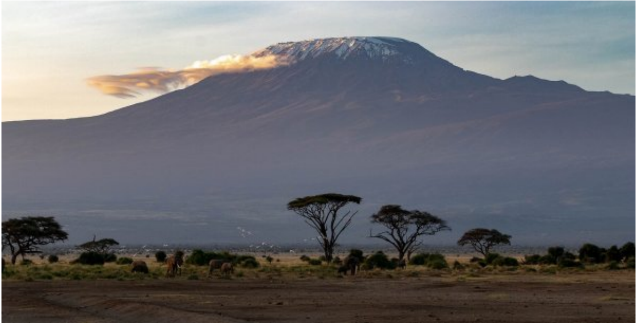
肯尼亚绿色氢战略和路线图

通过其最新的国家自主贡献(NDC)，肯尼亚的目标是到2030年将温室气体排放量减少三分之一。肯尼亚是绿色能源转型的先行者，并取得了重大进展，其90%以上的电力来自可再生资源。