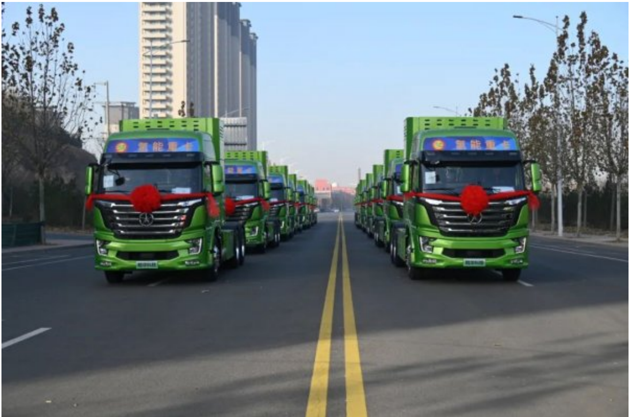
本次交付的氢能重卡为大运牌49吨牵引车，燃料电池系统均由鲲华科技配套。搭载鲲华科技125kW燃料电池系统的这批氢能牵引车，最大牵引重量38吨，一次加氢续驶里程可达450公里，最高时速89公里。