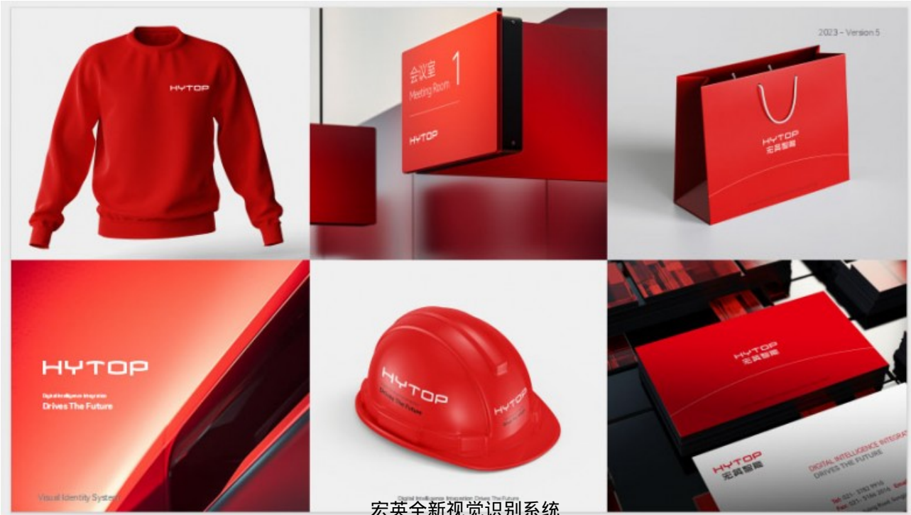
宏英全新视觉识别系统

视觉设计同时隐含地平线的概念，寓意着宏英脚踏实地、不断开拓的探索精神，揭示出宏英创造美好世界的愿望。