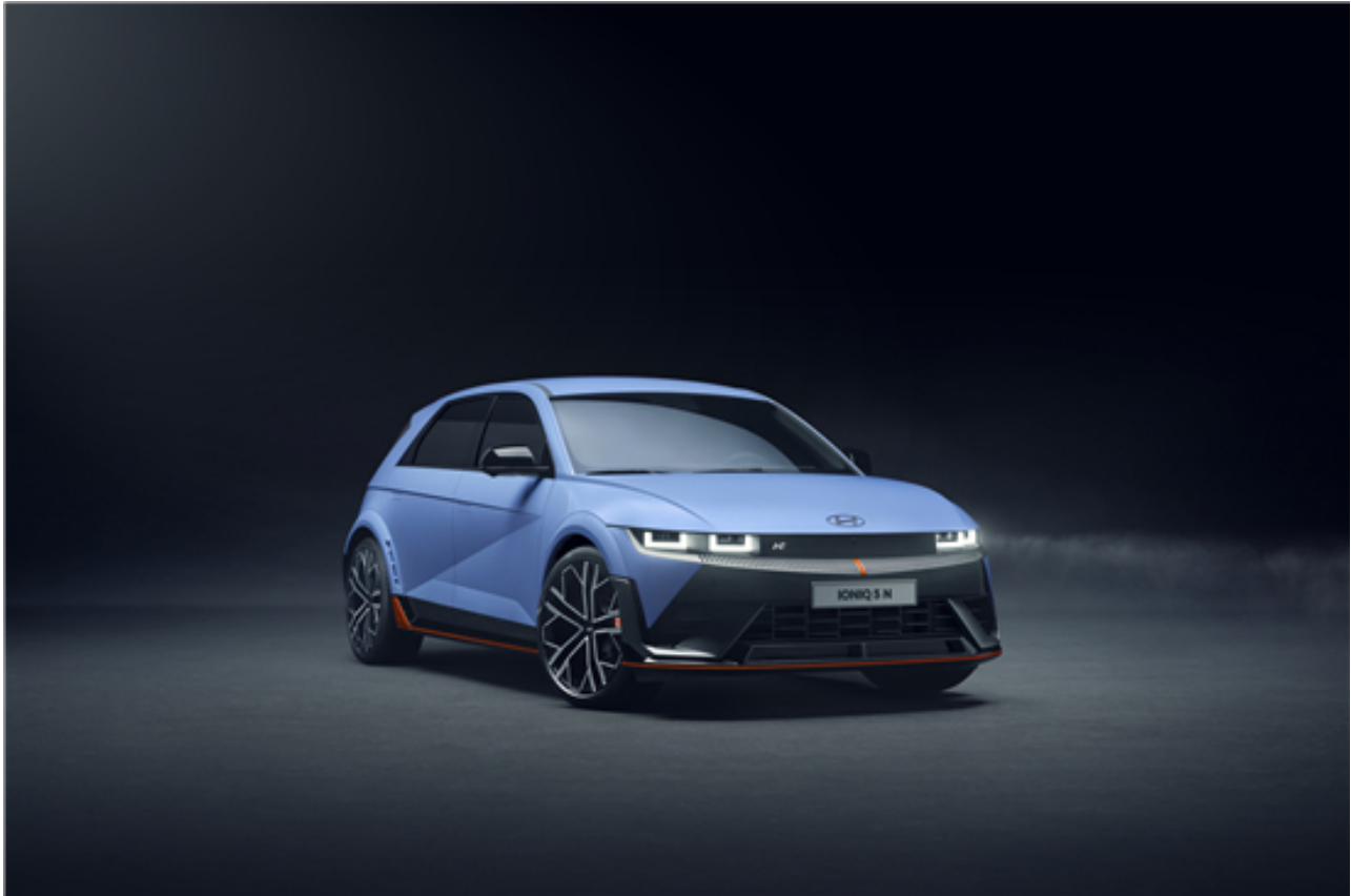
现代汽车高性能N品牌IONIQ 5 N的卓越风姿

在IONIQ 5 N获奖之后，现代汽车全球首席运营官José Muñoz表示：“我们将这一荣誉献给那些热爱高性能汽车的热情客户，我们将继续提供令人兴奋的汽车产品。我们很高兴能够在这个电动性能车的新时代引领潮流，并致力于不断挑战智能出行领域的极限。”此前IONIQ 5 N已获得Top Gear的2023年度最佳汽车奖，并在纽北赛道创造了最快的电动SUV圈速。