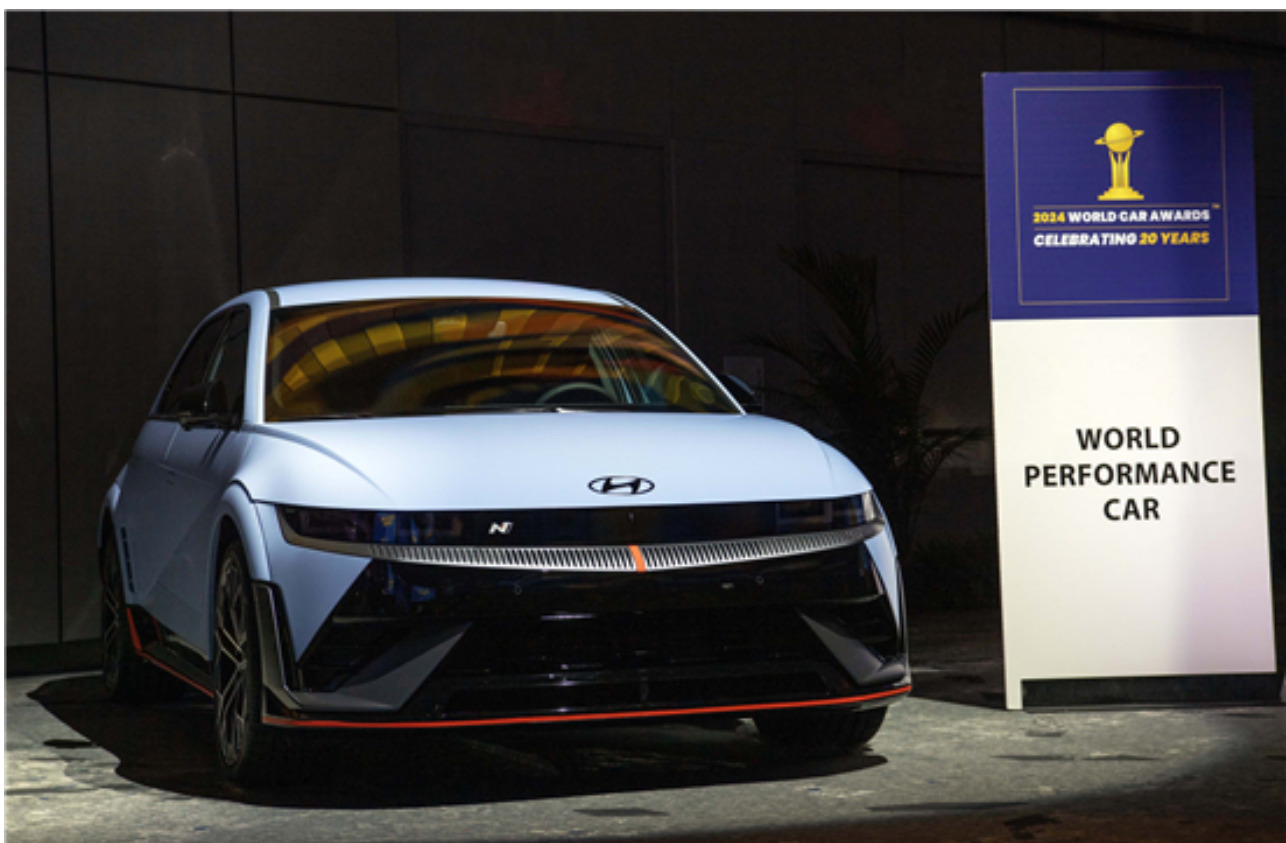
现代汽车N品牌高性能电动车IONIQ 5 N斩获2024“世界年度性能车”奖

3月27日，在纽约车展上举办的2024世界汽车大奖（World Car Awards, WCA）颁奖典礼上，现代汽车旗下N品牌首款高性能电动车IONIQ 5 N荣获2024年“世界年度性能车（World Performance Car）”大奖。继现代汽车纯电动车型IONIQ 5和IONIQ 6分别斩获2022年和2023年世界年度车奖（World Car of the Year）、世界年度车设计奖（World Car Design of the Year）和世界年度电动车奖（World Electric Vehicle）之后，凭借此次IONIQ 5 N的获奖，现代汽车不仅连续3年登上世界汽车大奖的领奖台，也将世界汽车大奖的获奖数增加到了7个，展现了现代汽车旗下电动产品的绝对实力。