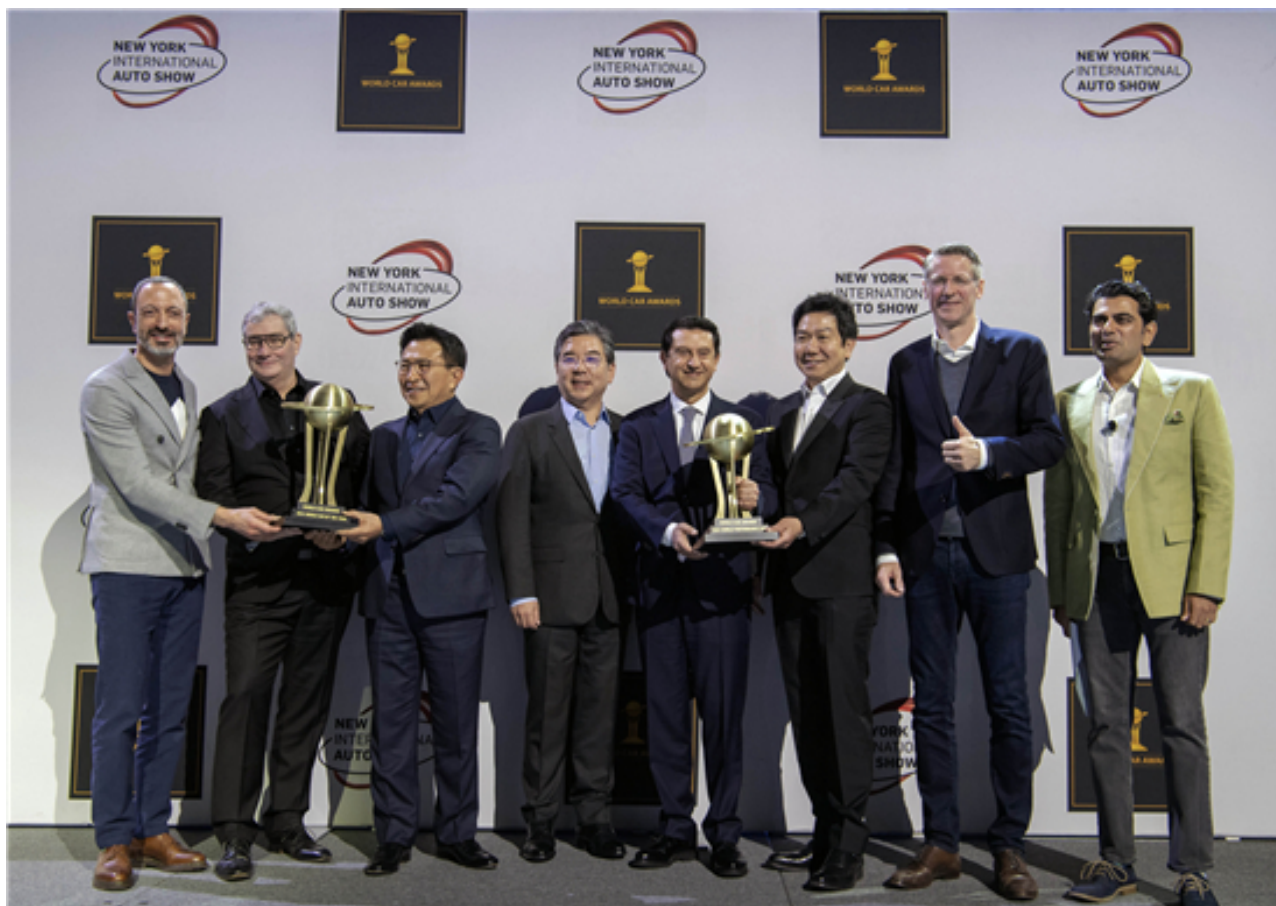
现代汽车高性能N品牌IONIQ 5 N 2024年“世界年度性能车”颁奖现场

现代汽车CEO张在勋表示：“我们很高兴IONIQ 5 N能获得这次世界年度性能车奖。这一认可是对现代汽车致力于突破电动车性能和创新界限的最佳认可。在过去的三年里，通过努力，现代汽车总共获得了七项世界汽车大奖。我们很自豪能够实现连续的获奖，这也进一步巩固了现代汽车在全球电动汽车行业的领导者地位。”