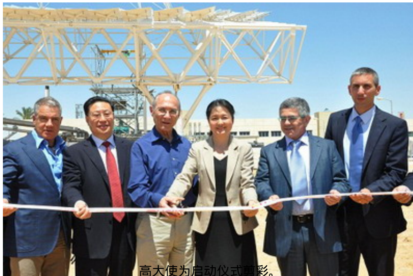
高大使为启动仪式剪彩。

Helio Focus公司成立于2007年，主要从事碟式太阳能发电系统的研发，技术水平处于世界领先地位。相比于传统的塔式、槽式太阳能发电系统，碟式系统有高效率，低损耗的优势。中国浙江三花集团于2010年向Helio Focus投资1050万美元，收购了30%的股份，成为国内首家直接投资以色列公司的中国企业。