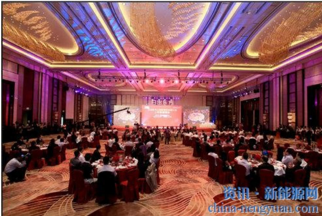
答谢晚宴现场 嘉宾云集。

5月20日晚，黄浦江畔，灯火璀璨。中国太阳能光热第一股——日出东方·太阳雨首次公开发行A股上市答谢酒会在浦东嘉里酒店隆重举行。