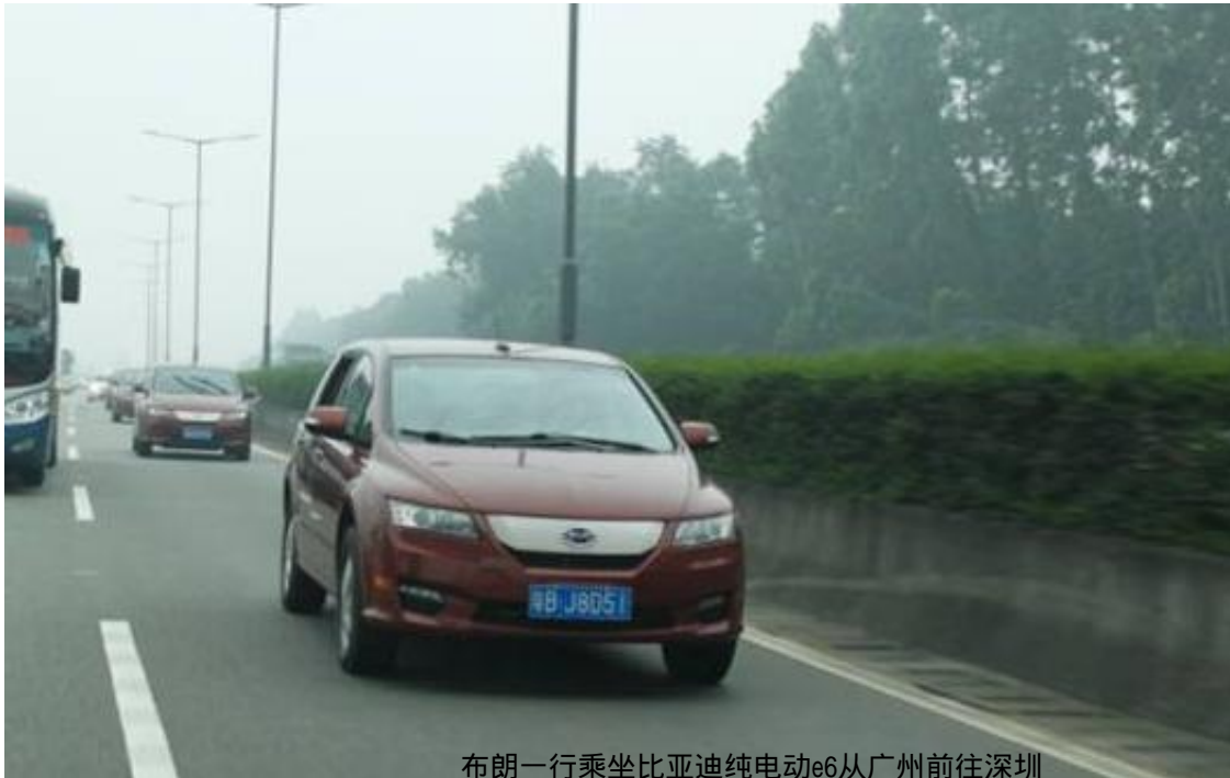
布朗一行乘坐比亚迪纯电动e6从广州前往深圳