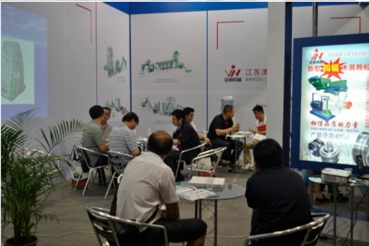
通过这次展会，展示了金梧公司从科研技术、生产制造、企业文化等各个环节的最新面貌，提升了金梧机械品牌的形象，增进了客户对公司的进一步了解与信任，增强了金梧机械在国内外市场中的优势地位。“相信品质的力量”是金梧人的口号，金梧公司本着诚信、务实、创新、进取的原则与所有新老朋友共绘蓝图、共创美好明天。

原文地址： http://www.china-nengyuan.com/news/51625.html