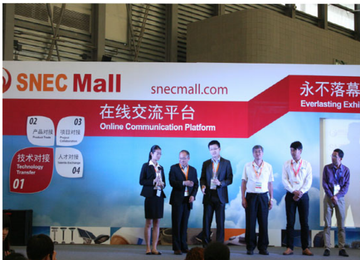
嘉宾为天源颁发“十大亮点”兆瓦级奖项

经过严格的专业评委评选，深圳天源从1500多家参展企业中脱颖而出，大会组委会授予天源新能源SNEC 2014“十大亮点”兆瓦级荣誉奖。这是天源继2012、2013年分别荣获SNEC“十大亮点”吉瓦级金奖以来又一次获得“十大亮点”奖项。