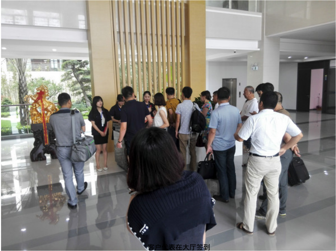
客户代表在大厅签到