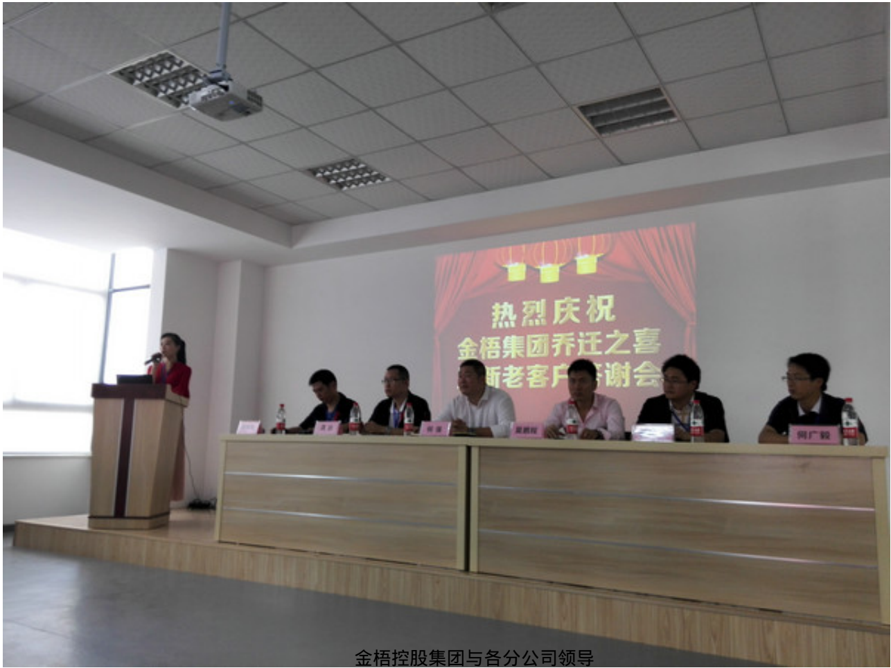
金梧控股集团与各分公司领导