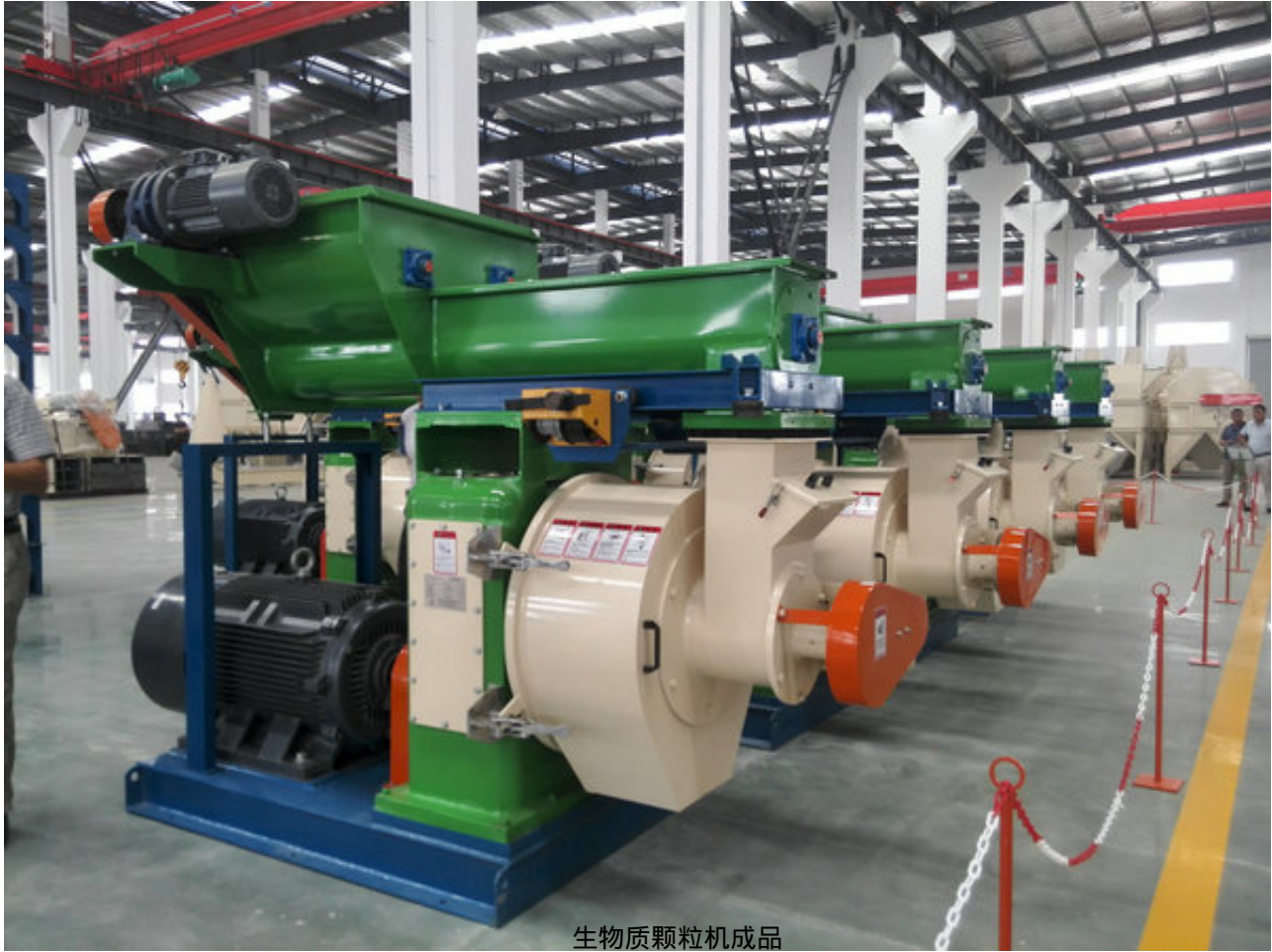
生物质颗粒机成品