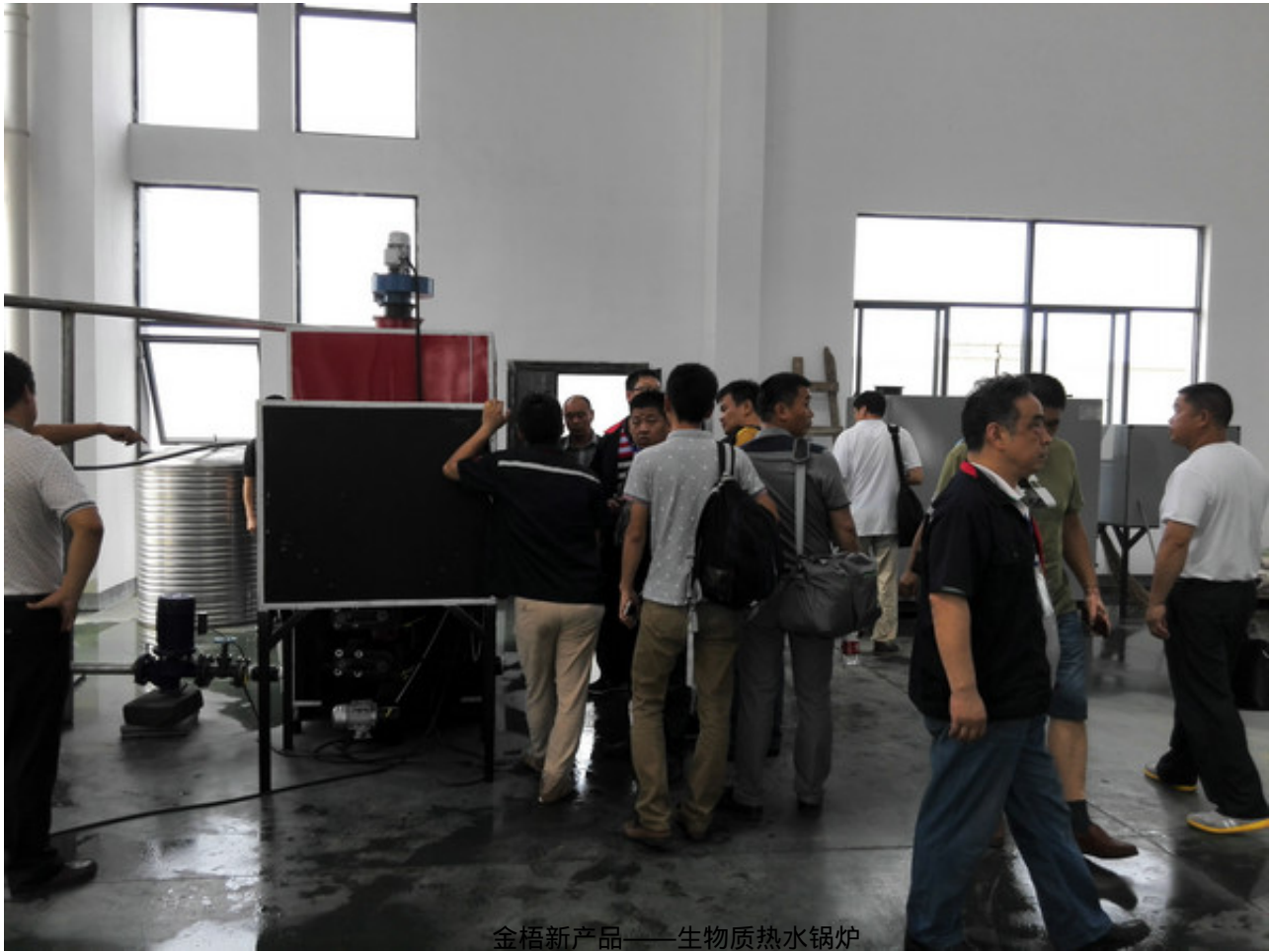
金梧新产品——生物质热水锅炉

原文地址： http://www.china-nengyuan.com/news/80260.html