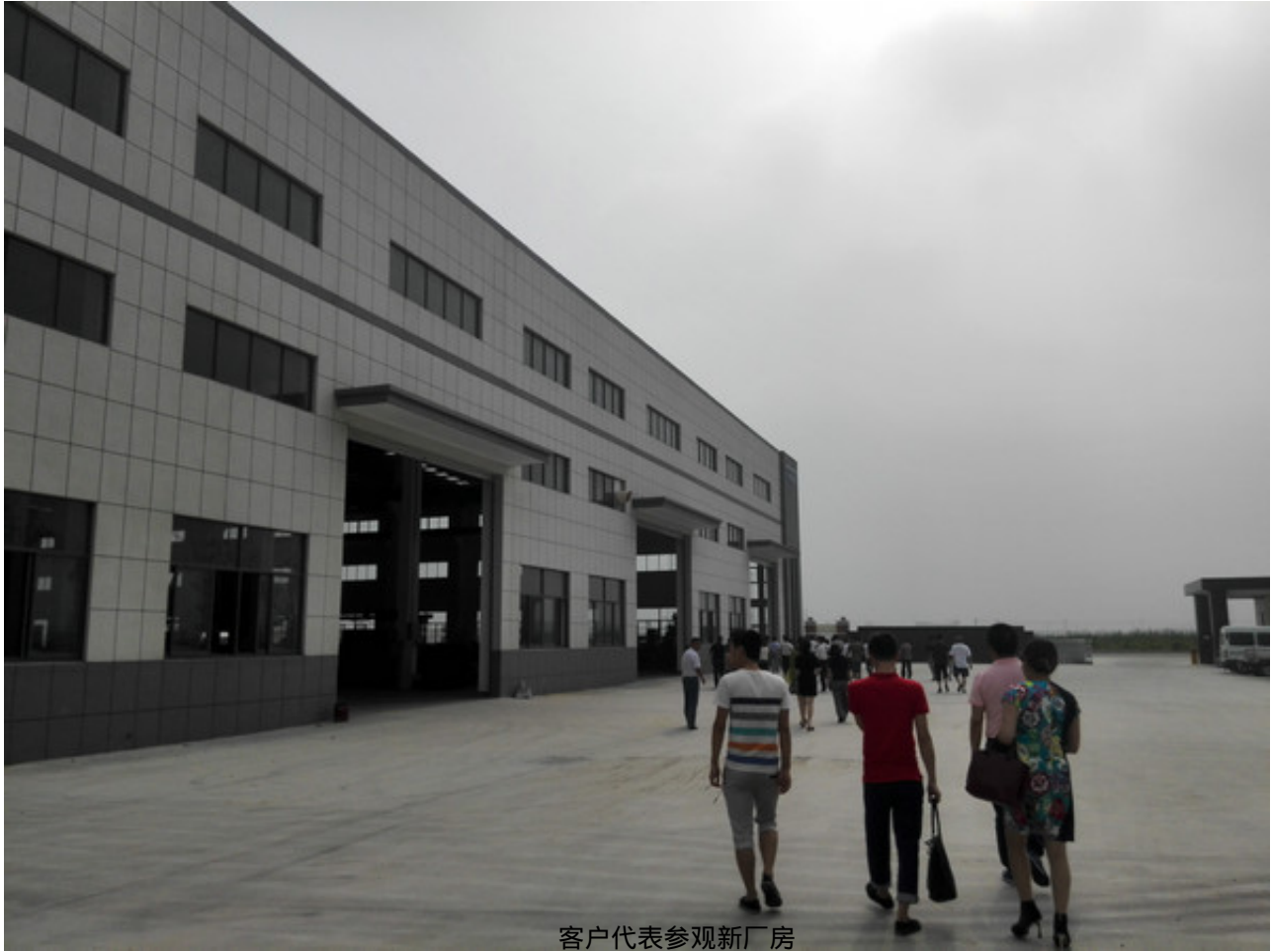
客户代表参观新厂房