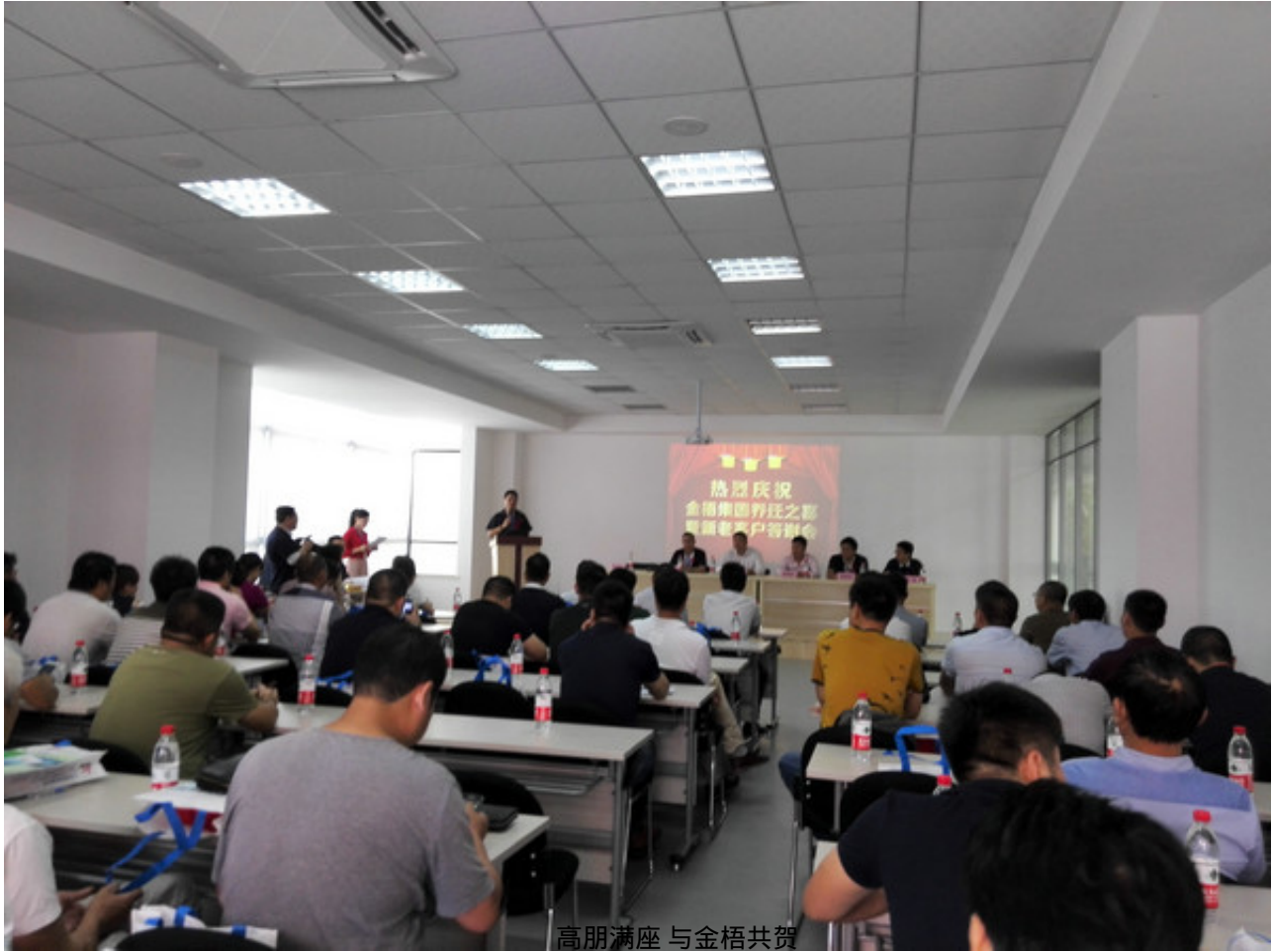
高朋满座 与金梧共贺