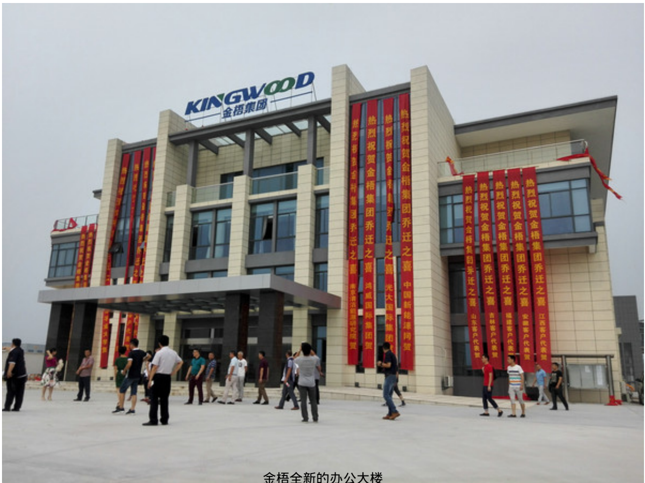
金梧全新的办公大楼

《中国新能源网》作为金梧集团的长期战略合作伙伴全程参与了本次答谢会，并携旗下《中国生物质燃料网》、《中国生物质能源网》、《中国生物质锅炉网》与各企业代表进行了良好的沟通与交流。在行业大数据，低成本、高回报、多渠道推广等各方面展现了领先优势。