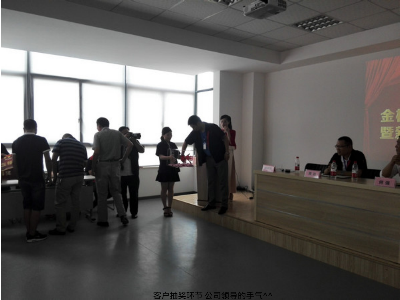
客户抽奖环节 公司领导的手气^^