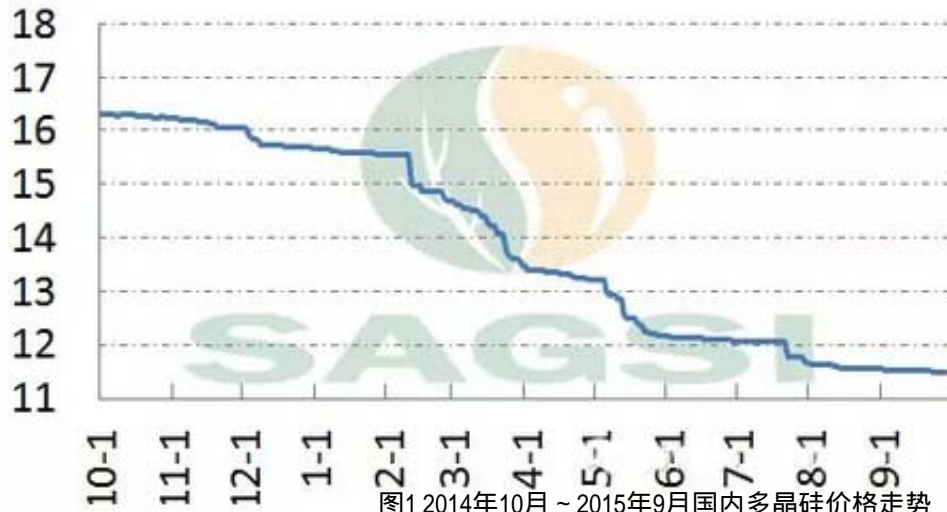
图1 2014年10月~2015年9月国内多晶硅价格走势