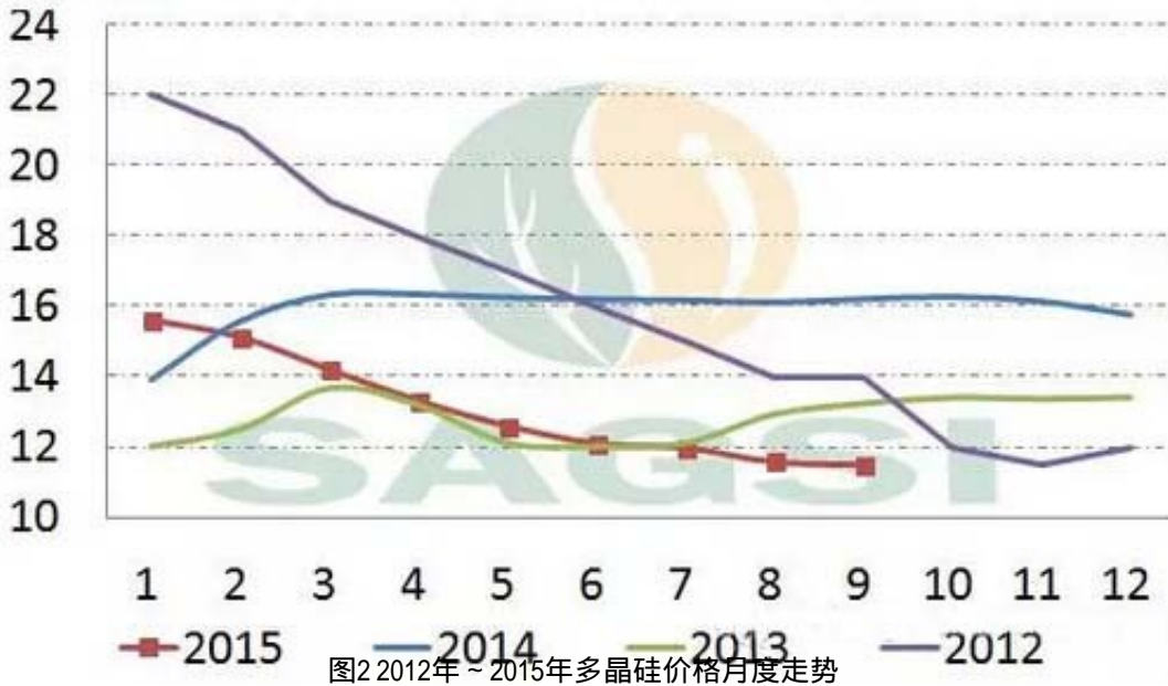
图2 2012年~2015年多晶硅价格月度走势

进出口数据显示，“58号文”影响显现，但是并未对市场造成实质的推动，8月份多晶硅进口量较7月份继续下滑，其中从美国进口198吨，环比大幅下降65.1%；按加工贸易方式进口量仅为25吨；从韩国进口居高不下，德国受价格承诺保护出口中国不受影响，进口量进一步压缩已经较为困难。SAGSI提业内后期重点关注从台湾转口规避“双反”征税货物，近两月台湾稳居进口来源地第三名。同时来自于马来西亚、挪威、沙特以及日本等地多晶硅进口填补，未来进口格局仍待关注。