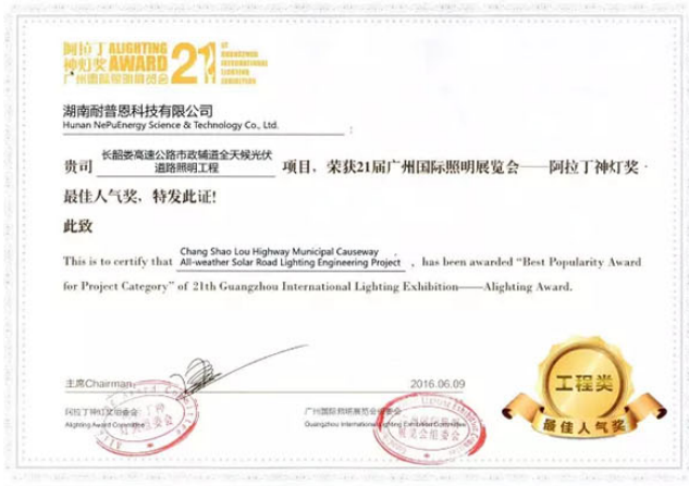
▲耐普恩喜夺最佳人气奖