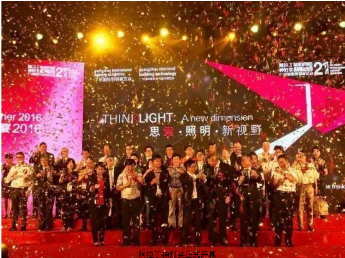
阿拉丁神灯奖正式开幕

2016年6月9日传统端午佳节之际，湖南耐普恩科技有限公司首次亮相由全球最大照明展——广州国际照明展览会主办的“阿拉丁神灯奖”颁奖典礼，凭借超级电容器在光伏路灯上的应用，从全国1176家申报单位中脱颖而出，接连斩获“十大技术奖”、“优秀工程奖”和“最佳人气奖”，成为本届阿拉丁神灯奖颁奖典礼上最耀眼的明星企业。