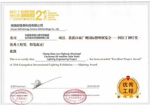
▲耐普恩喜获优秀工程奖