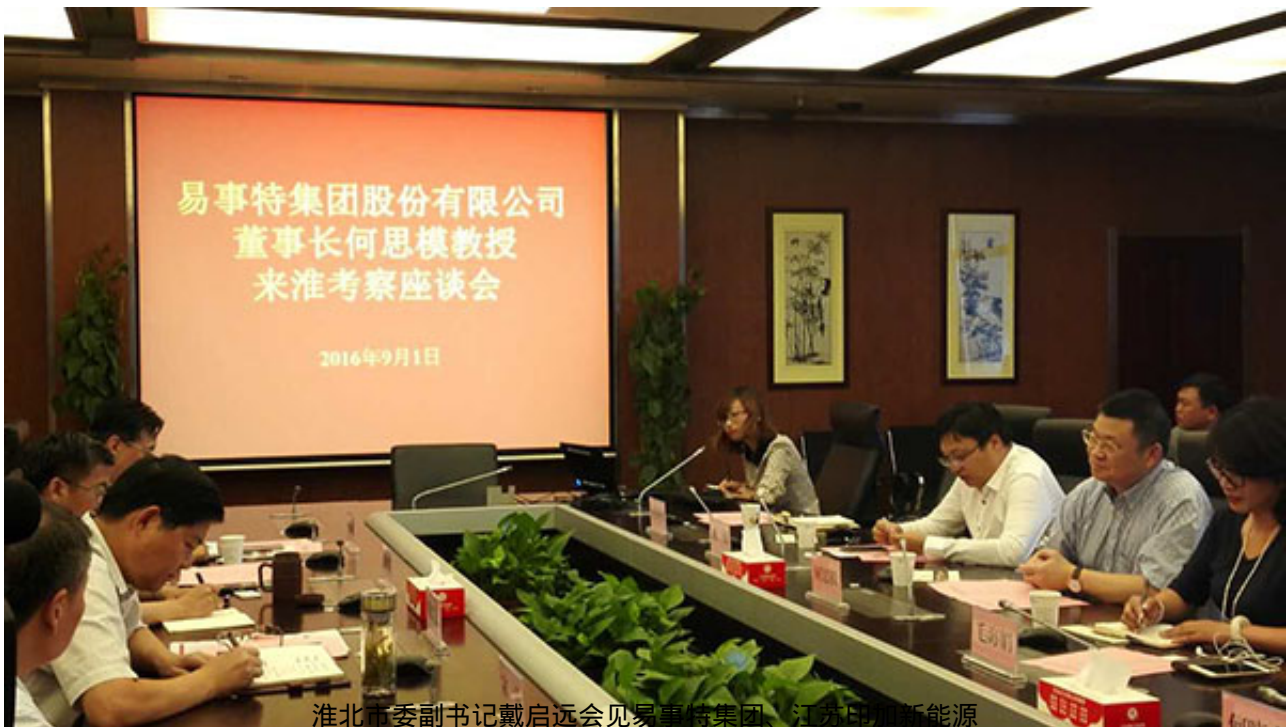
淮北市副书记戴启远会见易事特集团、江苏阳光新能源

淮北市副书记戴启远在座谈会上表示，在市委书记黄晓武等新一任领导班子的带领下，始终坚持发展为上，坚定不移促转型。淮北正处于发展转轨、产业转型、城市转向、动力转换的时期，一方面充分发挥区位、能源等优势，紧盯长三角、珠三角等地区招大引强；另一方面顺应国家产业发展趋势，大力发展电子信息等战略性新兴产业。大产业需要大项目支撑，淮北已成为投资的热土。戴启远副书记要求，各级各有关部门要通力合作，抓好落实，为企业在淮发展助一臂之力。