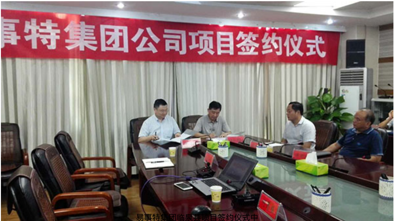
易事特集团临泉县项目签约仪式中

源的发展，加强与有关部门的协调沟通，尽快促进产业项目的实施落地，完善阜阳城市的信息化、智能化，推动民生建设进程。